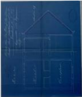
Van Den Broeck J., Korte Veldstraat nr. 13, dicht metsen van gevels op zolder woning, 12/9/1924 (BOUW#1924/9697)