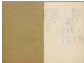
Gedichten van Alfons Gils (Scandagen_LZ28_011-023)