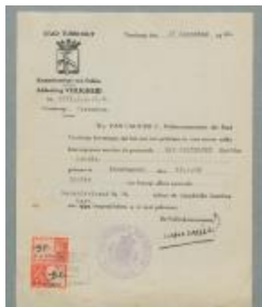
Verklaring van de politie, afdeling Veiligheid (Scandagen_LZ30_002-003)