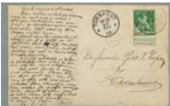
Alfons Gils (*1890) (Scandagen_LZ28_010)