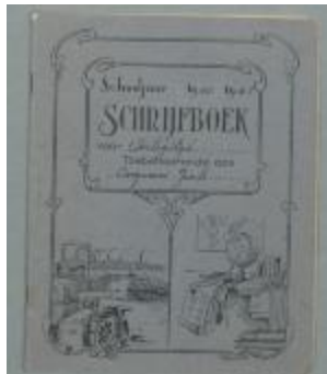
Dagboek "Oorlogstijd", Jaak Borgmans (Scandagen_LZ23_001-029)