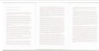
"Jos Huygaerts vlucht mei 1940 Turnhout Frankrijk en terug" (Scandagen_LZ32_002)