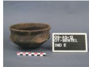
Schaal uit de vroege ijzertijd aangetroffen bij de opgraving in Bentel in Oud-Turnhout. (2009_181_E)