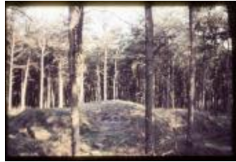
Archeologie (Dia 50_29)