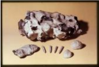
Archeologie (Dia 50_52)