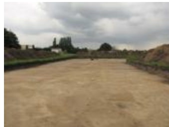
Foto's van het archeologische onderzoek aan de Bentel in Oud-Turnhout (Opgraving_Bentel)