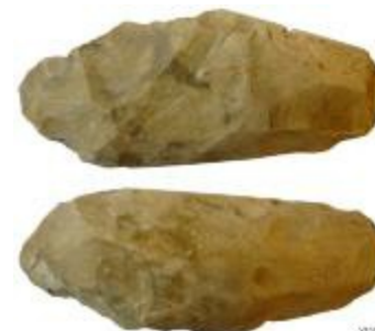
Neolithische bijl aangetroffen bij de opgraving in de Beukenlaan in Beerse (2009_150_00155)