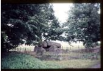
Archeologie (Dia 50_16)