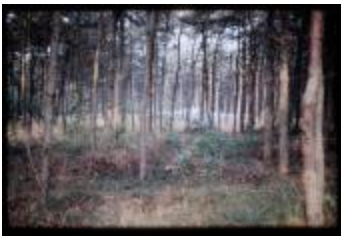
Archeologie (Dia 50_32)