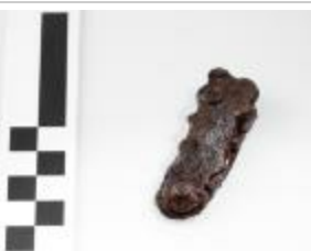
Fragment van een riemtong uit de merovingische periode aangetroffen bij de opgraving in de Krommenhof in Beerse. (2008_269_176)