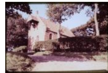
Archeologie (Dia 50_11)