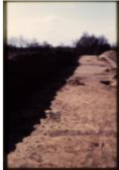
Archeologie (Dia 50_17)