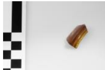
Glasfragment uit de ijzertijd aangetroffen bij de opgraving in de Krommenhof in Beerse. (2008_269_66)