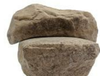
Volledige maalsteen uit de ijzertijd aangetroffen bij de opgraving in de Beekakkers in Beerse (2010_126_00465/00466)