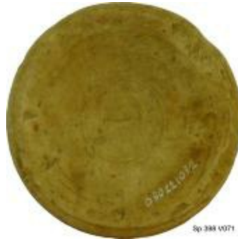
Speelschijf uit de Romeinse periode aangetroffen bij de opgraving in de Tijn- en Nelestraat te Turnhout. (2008_281_00071)