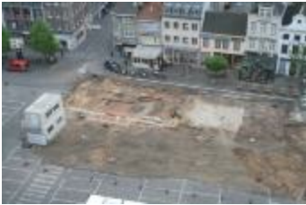
Foto's van het archeologische onderzoek aan de Grote Markt in Turnhout (Opgraving_Grote-Markt1)