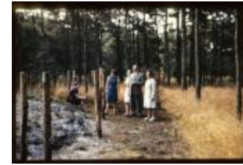
Archeologie (Dia 50_39)