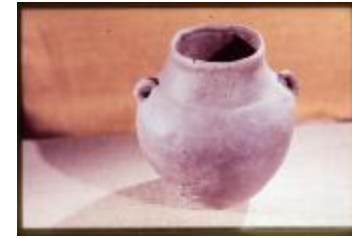
Archeologie (Dia 50_15)