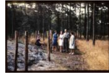
Archeologie (Dia 50_31)