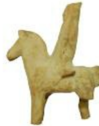
Keramische figurine uit de Romeinse periode aangetroffen bij de opgraving in de Tijn- en Nelestraat te Turnhout. (2008_281_00072)