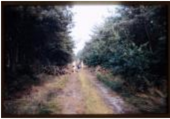
Archeologie (Dia 50_12)