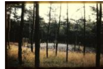
Archeologie (Dia 50_35)