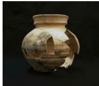
Maaslandse kookpot uit de hoge middeleeuwen aangetroffen bij de opgraving in Bentel in Oud-Turnhout. (2010_198_Ke)