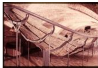
Archeologie (Dia 50_09)