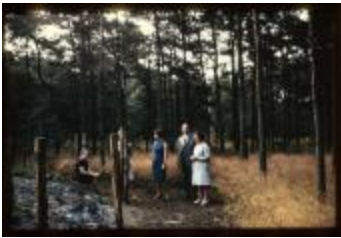
Archeologie (Dia 50_40)