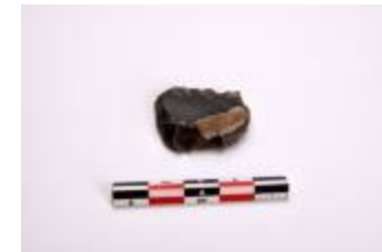
Schrabber teruggevonden tijdens het archeologisch onderzoek aan de Lindenhoeve in Vosselaar (2006_216_008)