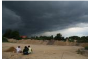
Archeologische onderzoek aan de Krommenhof in Beerse (Opgraving_Krommenhof)