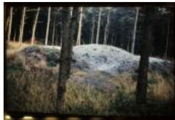
Archeologie (Dia 50_33)