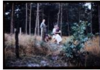
Archeologie (Dia 50_26)