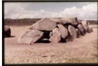
Archeologie (Dia 50_53)