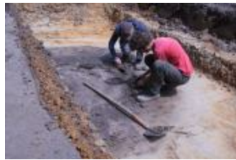
Archeologische onderzoek aan de Beekackers in Beerse (Opgraving_Beekackers)