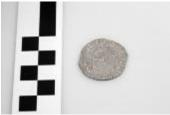
Munt uit de late middeleeuwen aangetroffen bij de opgraving in de Krommenhof in Beerse. (2008_269_409)