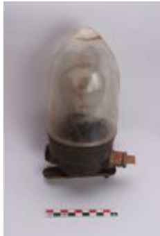
Lamp aangetroffen in een schuilkelder bij het archeologische onderzoek aan de Grote Markt in Turnhout (2011_164_1070)