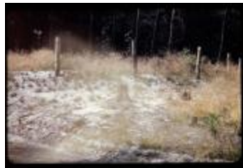
Archeologie (Dia 50_21)