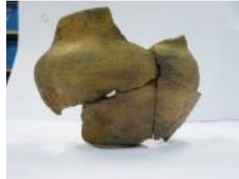
Aardewerkfragmenten aangetroffen bij de opgraving in de Beekakkers in Beerse (2010_126_00117)