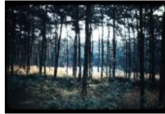
Archeologie (Dia 50_30)