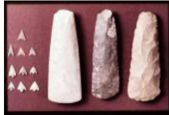
Archeologie (Dia 50_54)