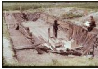
Archeologie (Dia 50_14)