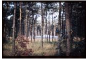
Archeologie (Dia 50_25)