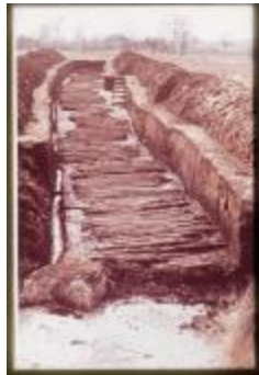
Archeologie (Dia 50_41)