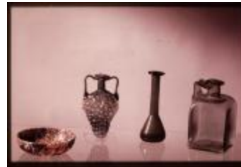
Archeologie (Dia 50_06)