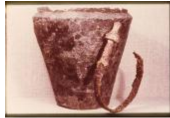
Archeologie (Dia 50_02)