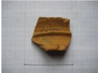
Aardewerk-fragment uit de Merovingische periode aangetroffen bij de opgraving in Bentel in Oud-Turnhout. (2009_181_Me)