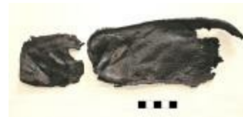
Schoenzool aangetroffen bij de opgraving in Bentel in Oud-Turnhout. (2010_198_Le)