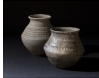
Knikwandpotten uit de Merovingische periode aangetroffen bij de opgraving in de Krommenhof in Beerse. (2008_269_269/184/246)