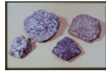
Archeologie (Dia 50_47)