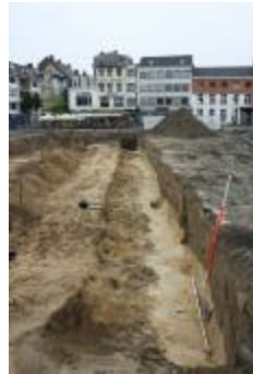
Foto's van het archeologische onderzoek aan de Grote Markt in Turnhout (Opgraving_Grote-Markt2)