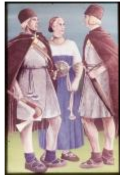
Archeologie (Dia 50_42)