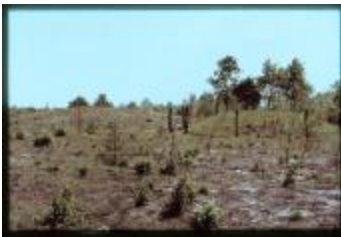
Archeologie (Dia 50_44)