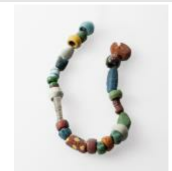
Kralen uit de merovingische periode aangetroffen bij de opgraving in de Krommenhof in Beerse (2008_269_193-195)