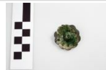
Fibula uit de merovingische periode aangetroffen bij de opgraving in de Krommenhof in Beerse. (2008_269_194)