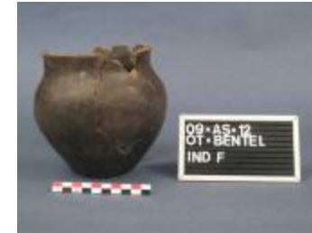
Pot uit de vroege ijzertijd aangetroffen bij de opgraving in Bentel in Oud-Turnhout. (2009_181_F)