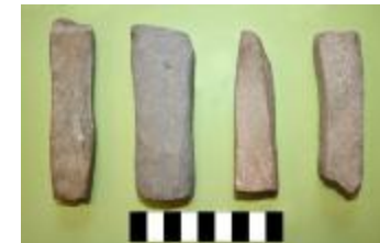
Wetsteen uit de volle middeleeuwen aangetroffen bij de opgraving in Bentel in Oud-Turnhout. (2010_198_We)