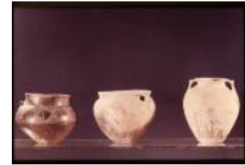
Archeologie (Dia 50_03)