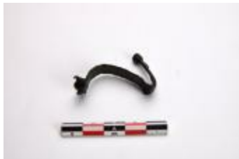
Fibula teruggevonden tijdens het archeologisch onderzoek aan de Lindenhoeve in Vosselaar (2006_216_063)