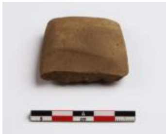
Wetsteen uit de Karolingische periode aangetroffen bij de opgraving in de Mezenstraat in Beerse (2006_207_64)