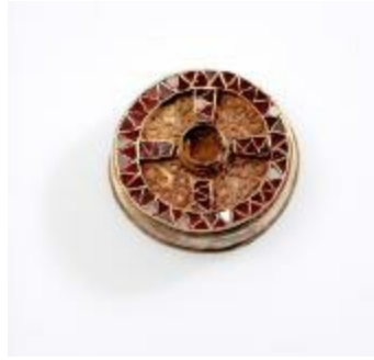
Fibula uit de merovingische periode aangetroffen bij de opgraving in de Krommenhof in Beerse (2008_269_245)