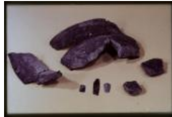
Archeologie (Dia 50_50)