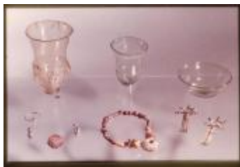
Archeologie (Dia 50_08)