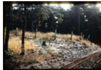
Archeologie (Dia 50_34)