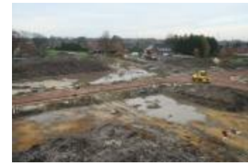
Foto's van het archeologische onderzoek aan de Beukenlaan in Beerse (Opgraving_Beukenlaan)