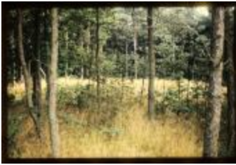
Archeologie (Dia 50_36)