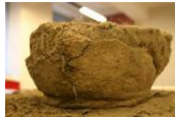
Archeologische urne uit de bronstijd aangetroffen bij de opgraving in de Mezenstraat in Beerse (2006_207_141)