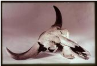
Archeologie (Dia 50_48)