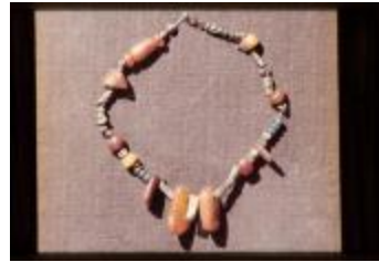
Archeologie (Dia 50_01)