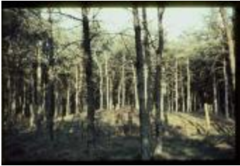
Archeologie (Dia 50_28)