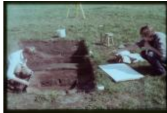
Archeologie (Dia 50_49)