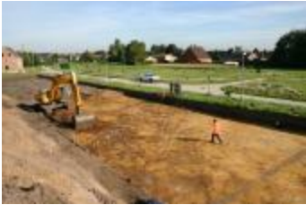
Archeologische onderzoek aan de Mezenstraat in Beerse (Opgraving_Mezenstraat)