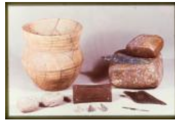
Archeologie (Dia 50_46)