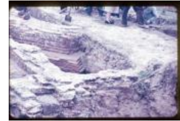
Archeologie (Dia 50_19)