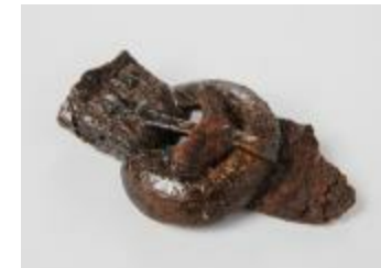
Gesp uit de merovingische periode aangetroffen bij de opgraving in de Krommenhof in Beerse (2008_269_117)