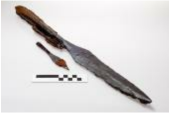
Lanspunt en twee pijlpunten uit de merovingische periode aangetroffen bij de opgraving in de Krommenhof in Beerse (2008_269_202)