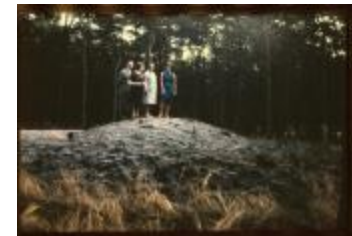
Archeologie (Dia 50_23)