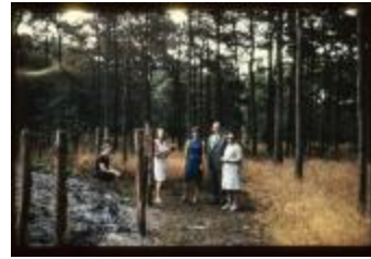
Archeologie (Dia 50_38)