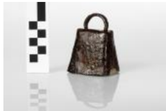
Koebel uit de Romeinse periode aangetroffen bij de opgraving in de Tijn- en Nelestraat te Turnhout. (2008_281_00694)