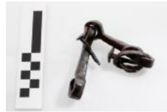
Paardenbit uit een potstal aangetroffen bij de opgraving in de Tijn- en Nelestraat te Turnhout. (2008_281_00188)