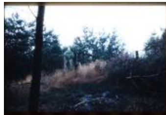
Archeologie (Dia 50_22)