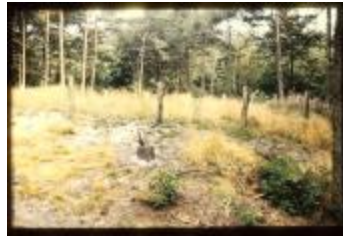
Archeologie (Dia 50_37)