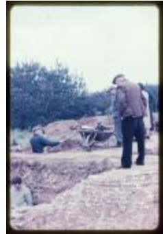
Archeologie (Dia 50_18)