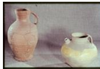
Archeologie (Dia 50_10)