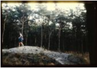
Archeologie (Dia 50_24)