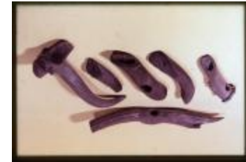
Archeologie (Dia 50_51)