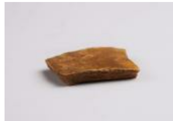
Andenne aardewerk uit de volle middeleeuwen aangetroffen bij de opgraving in de Mezenstraat in Beerse (2006_207_130)