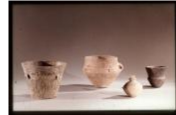
Archeologie (Dia 50_55)