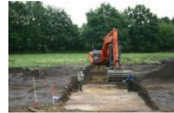
Archeologische onderzoek aan de Lindenhoeve in Vosselaar (Opgraving_Lindehoeve)