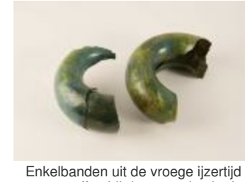
Enkelbanden uit de vroege ijzertijd aangetroffen bij de opgraving in de Beekakkers in Beerse (2010_126_469_1)