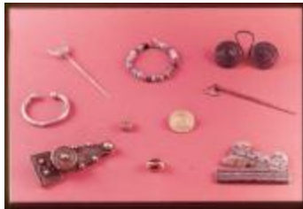
Archeologie (Dia 50_04)