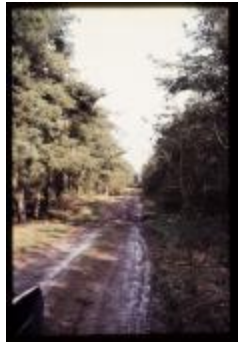
Archeologie (Dia 50_13)