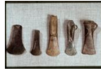
Archeologie (Dia 50_43)