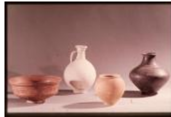
Archeologie (Dia 50_05)