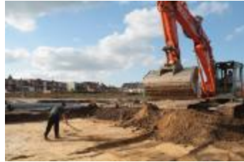
Archeologische onderzoek aan de Tijn-Nelestraat in Turnhout (Opgraving_Tijn-en-Nelestraat)