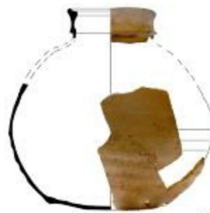
Kookpot uit de volle middeleeuwen aangetroffen bij de opgraving in de Beukenlaan in Beerse (2009_150_00060)