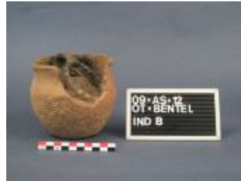
Urne uit de vroege ijzertijd aangetroffen bij de opgraving in Bentel in Oud-Turnhout. (2009_181_B)