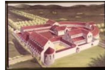
Archeologie (Dia 50_07)