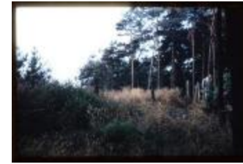
Archeologie (Dia 50_27)