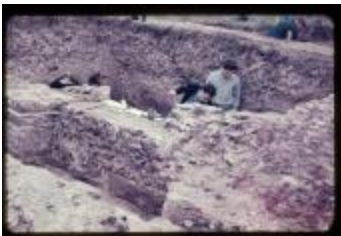
Archeologie (Dia 50_20)