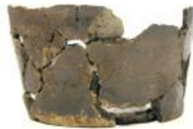
Archeologische pot uit de ijzertijd aangetroffen bij de opgraving in de Lindenhoeve in Vosselaar (2006_216_64)