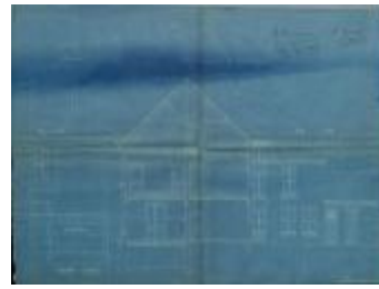
Janssens Ant., Staatsbaan van Antwerpen naar Turnhout Wijk O nr. 426a (deel), bouwen huis, 9/6/1903 (BOUW#1903/3707)