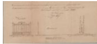
Nijs Jos, aan eigendom gelegen langs de staatsbaan van Antwerpen naar Turnhout op het grondgebied van de stad Turnhout tussen paal 40 en 41, plaatsen ijzeren hekken, 4/11/1899 (BOUW#1899/3321)