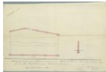
Van Genechten W., Staatsbaan van Antwerpen naar Turnhout, bouwen afsluitingsmuur, 17/12/1903 (BOUW#1903/3775)