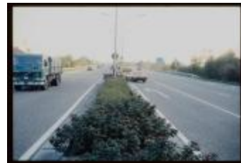
Brug (Dia 's container 7_789 + 7_808)