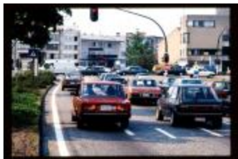
Kruispunt (Dia 55_10_2228)