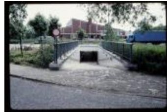
De voetgangers- en fietstunnel onder de Steenweg op Zevendonk ter hoogte van de Schorvoortstraat te Turnhout (container 45_679)