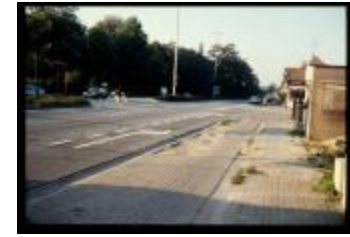
Kruispunt (Dia container 7_814)