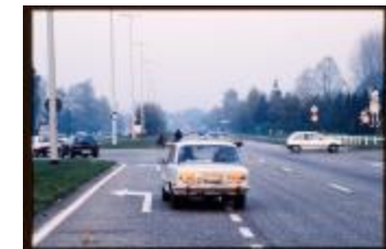
Kruispunt (Dia container 7_796)