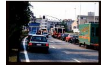
Kruispunt Parklaan (Dia 55_05_2223)