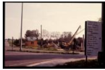
Kruispunt (Dia container 4_32)