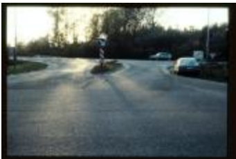
Af- en oprit (Dia container 29_734)