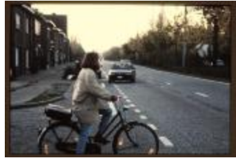
Kruispunt (Dia's container 29_736 tot 738 en 740 tot 744)