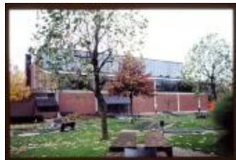
Stedelijke sporthal en minigolfbaan (Dia container 62_A06)