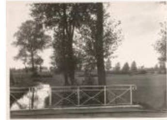
De Aa gezien v.o.d. brug van Stwg. Turnhout-Zevendonk (Foto 00920-01)