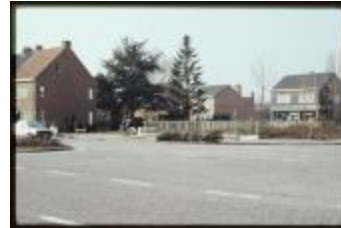
Zevendonk (Dia container 29_718)