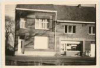
Stwg. Op Zevendonk (1971) (Foto 06944-01)