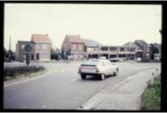
Kruispunt (Dia's container 29_732 + 35)