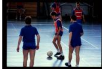
Zaalvoetbalmatch (Dia's containers 59_07 + 60_11)