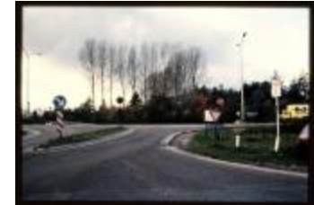
Af- en oprit (Dia container 29_733)