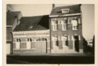
Stwg. Op Zevendonk (1971) (Foto 06944-02)