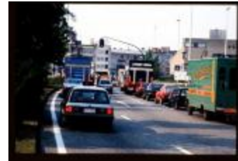
Kruispunt (Dia 55_02_2223)