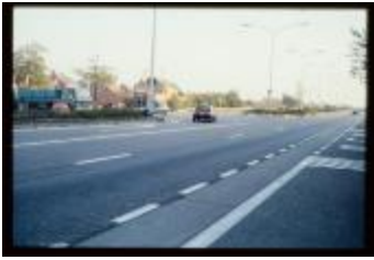
Brug (Dia container 7_797)