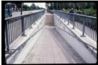
De voetgangers- en fietstunnel onder de Steenweg op Zevendonk ter hoogte van de stedelijke sporthal te Turnhout (container 45_678)