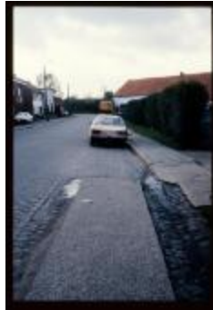
Slagmolenstraat (Dia container 7_816)