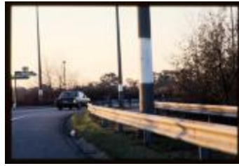
Oprit (Dia container 7_798)