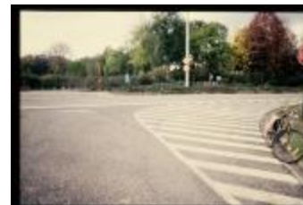
Kruispunt (Dia container 7_795)