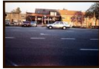
Kruispunt (Dia container 7_805)