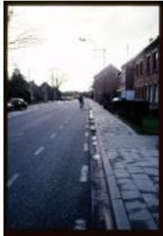
Steenweg op Zevendonk (Dia container 7_815)