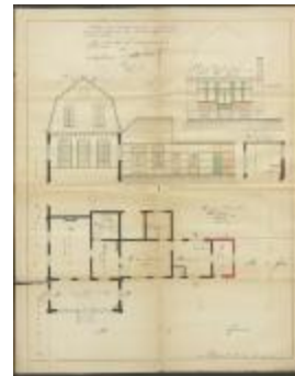
Verwaest J., Steenweg op Zevendonk, veranderingswerken aan eigendom, 8/10/1923 (BOUW#1923/9300)