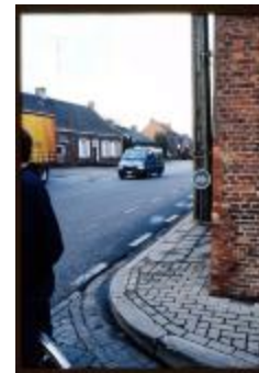
Kruispunt (Dia's container 7_818 + 820 + container 29_750)