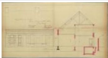
Jespers-Schenkels F., Staatsbaan van Turnhout naar Diest, herbouwen 3 woningen, 5/4/1902 (BOUW#1902/3558)