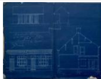
Hermans J., Staatsbaan van Turnhout naar Diest nr. 1328c, veranderingen aan woning en ernaast bouwen nieuw huis, 28/10/1904 (BOUW#1904/3875)