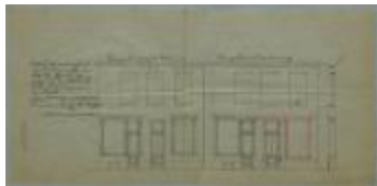
Van Utrecht-Moons Adr., Staatsbaan van Turnhout naar Diest sectie T nr. 149i van het kadaster, veranderingen doen aan winkelraam van huizing, 25/4/1899 (BOUW#1899/3268)