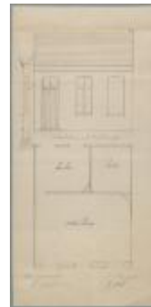
Pul, Baan Turnhout - Diest, Wijk N nr 1313, bouwen woning, 27/11/1879 (BOUW#196)