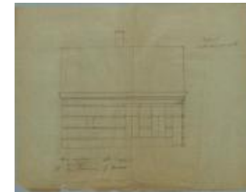
Brouwers J., Staatsbaan van Turnhout naar Diest wijk L nrs. 409a en 409b, bouwen huis, 16/7/1901 (BOUW#1901/3485)