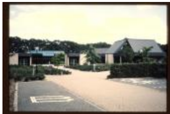
Crematorium (Dia's container 41_3622 + 26)