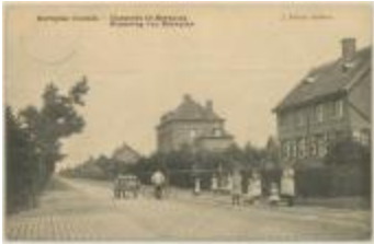
Merxplas (Colonie) - Chaussée de Merxplas Steenweg op Merxplas (Prentbriefkaart 119_058)