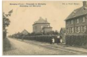
Merxplas (Colonie) - Chaussée de Merxplas Steenweg op Merxplas (Prentbriefkaart 119_059)