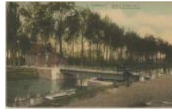
7. Turnhout Brug 2 Nieuwe vaart / Pont 2 Nouveau canal (Prentkaart 68_041, 68_042, 68_)