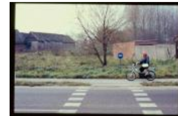
Oversteekplaats (Dia container 13_2724)