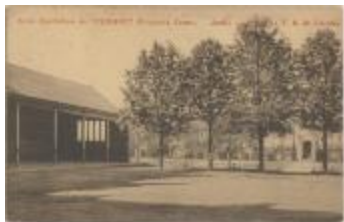
Ecole Apostolique de Turnhout (Belgique). Ferme. Jardin - Grotte de N.D. de Lourdes. (Prentbriefkaart 33_045)