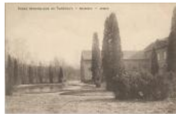
Ecole Apostolique de Turnhout. - Nazareth. - Jardin. (Prentbriefkaart 33_047)