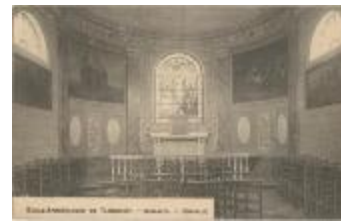
Ecole Apostolique de Turnhout. - Nazareth. - Chapelle. (Prentbriefkaart 33_048)