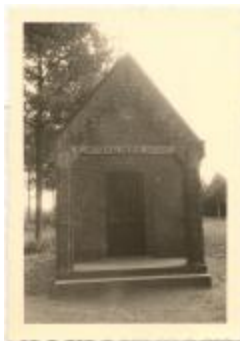
Kapel van aartsengel Michaël (Foto 00207_01)