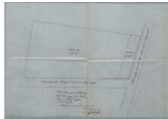
Backx Aug. Jos., Steenwegen van Brug 2 naar Heizijde en van Heizijde naar Nazareth Sectie B nr. 738e en deel van 741a, planten levendige haag met pindraad vóór eigendom, 10/11/1916 (BOUW#1916/5538)