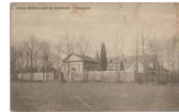
Ecole Apostolique de Turnhout. - Nazareth (Prentbriefkaart 33_044)