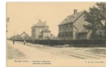
Merksplas (colonie). - Chaussée de Merksplas. Steenweg op Merksplas (Prentbriefkaart 119_057)