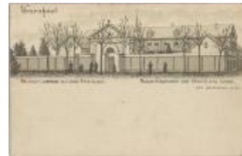
Turnhout Nazareth, Campagne de l'école Apostolique. Nazareth, buitenhof der Apostolieke School. (Prentbriefkaart 33_043)