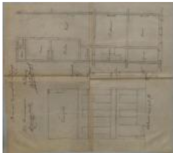
Van Liempt A., Staatsbaan van Turnhout naar Hoogstraten wijk P nr. 667 (Steenweg van Merksplas), bouwen huis, [-] /10/1902 (BOUW#1902/3618)