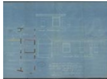
Crols J., hoek Kwakkelstraat met Korte Veldstraat, veranderingen aan eigendom, 25/6/1923 (BOUW#1923/9159)