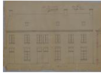
Dufour-Dessauer , Papenstraatje, nrs. 15/25, bouwen 3 burgerswoningen in vervanging van bestaande nummers 15/25, 19/5/1894 (BOUW#1900)