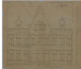
Taeymans, Antwerpse Steenweg, bouwen 3 huizen, 29/9/1894 (BOUW#1904)