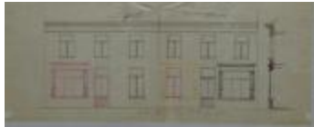
Schoeters August, Warandestraat , nr. 369[s], steken vitrien en wederzijds verplaatsen vensterraam, 10/3/1894 (BOUW#1887)