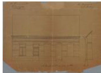
Mertens-Schillemans Guil., baan van Turnhout naar Tilburg- Patersstraat, nrs. 125 en 127 / sectie [Q] nrs. 122 en 123, heropbouwen gevel huizing, 5/4/1894 (BOUW#1894)