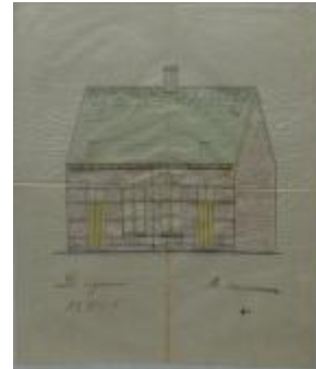
Weyts Adr., achter het station, palende noord eigendom, zuid en oost de straat en west Sint-Pietersgasthuis, "De Martelaren"