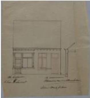
Van Belmont Adr. , Otterstraat, veranderingen aan huis, 1/5/1894 (BOUW#1898)