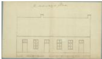
De Somer van [.....], weg van Antwerpse steenweg naar gehucht Stokt, bouwen 3 woningen ivv 3 bouwvallige, 12/11/1894 (BOUW#1907)