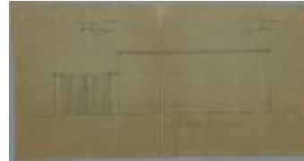
Geentjens P., baan van Turnhout naar Hoogstraten, Sectie P nr. 66e, bouwen hangaar met inrijpoort, 29/9/1894 (BOUW#1905)