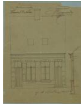
Devolder Florant, Kruishuis, bouwen 2 werkmanswoningen, 6/10/1894 (BOUW#1909)