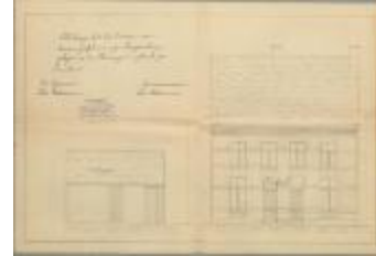
Vekemans Ferd., Staatsbaan van Turnhout naar Lille Sint Pieter Wijk O nrs. 361c en 360a2 - tussen kilometerpalen 0 en 1 - linkerzijde, bouwen 7 gelijkvormige huizen, 15/4/1908 (BOUW#1908/4313)