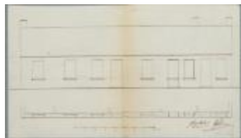
Dierckx J.A.A., Steenweg van Turnhout naar Mol, Wijk 7 nr 49, De Zwaan kleine verandering aan huizing, 5/10/1857 (BOUW#510)