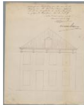
Brosens j., Steenweg van Turnhout naar Mol, Wijk 2 nr 7, herstellen corniche, 19/10/1869 (BOUW#461)