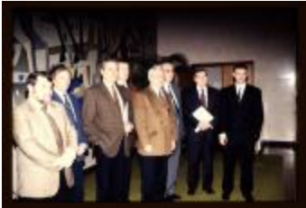
Schepencollege (Dia container 58_07)