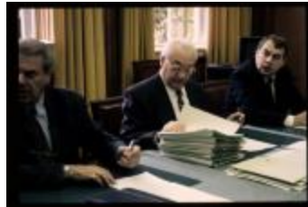
Vergaderend college (Dia container 38_3449)