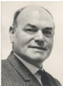
Portret Thange / burgemeester Ravels / volksvertegenwoordiger (Foto 06790-02)