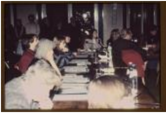
Agalev- en PVV-fracties (Dia container 38_3491)