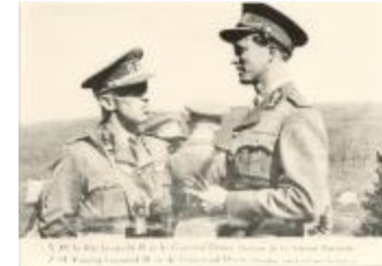
Koning Leopold III en Lt. Gen. Denis Min. Landsverdediging (Foto 01332_01)