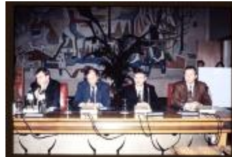
Leden (Dia container 38_3477)