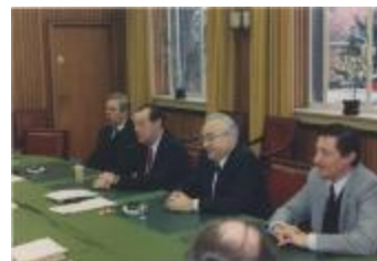
Vergadering Schepencollege (1988) (Foto 05934-03)