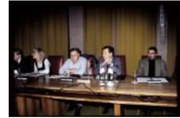
SP-fractie (Dia's container 38_3432 + 8)