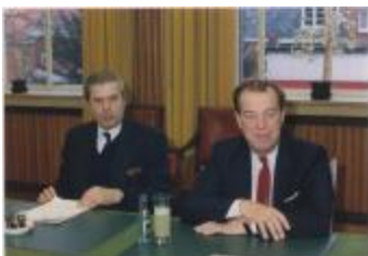
Vergadering Schepencollege (1988) (Foto 05934-01)