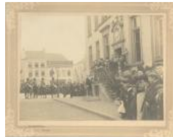
Inhuldiging burgemeester Victor van Hal (Foto 00968_01)