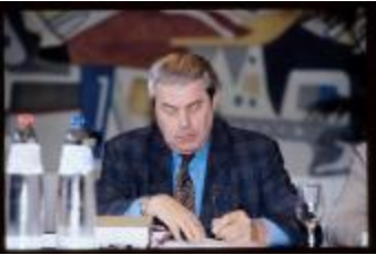
Schepen (Dia container 22_41)