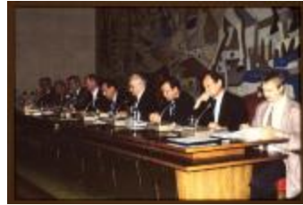
Gemeenteraadszitting (Dia container 26_3880)