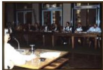
Vergadering (Dia container 47_3080)