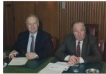
Vergadering Schepencollege (1988) (Foto 05934-07)