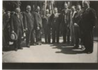
KVRO dag / Bezoek minister Hoste 1937 (Foto 01175-07)