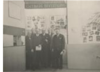
Lichtweek Dec. 1937 / St. Pieter, stadhuis, Zegeplein... (Foto 01316-02)