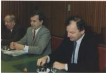
Vergadering Schepencollege (1988) (Foto 05934-09)