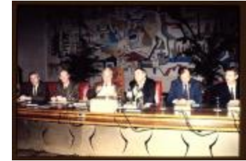
Schepencollege (Dia container 27_4025)