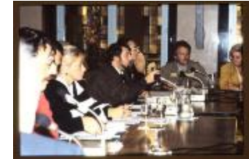
Vergadering (Dia container 47_3045)