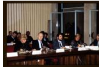
Vergadering (Dia container 57_11)