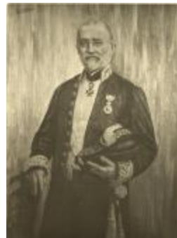
Portret P. Dierckx : houtschooltekening Ch. Vander Velpen (Foto 04726_01)