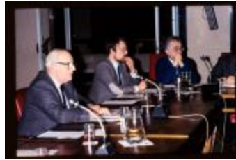
Vergadering (Dia container 57_01)