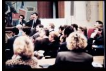
Vergadering in de raadzaal van het stadhuis op de Grote Markt te Turnhout. (container 40_3323)