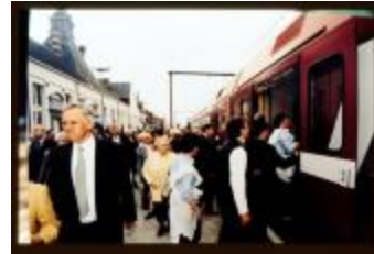
Instappende mensen (Dia container 62_A09)