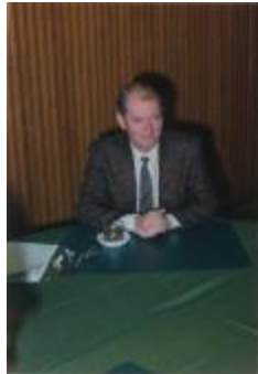
Vergadering Schepencollege (1988) (Foto 05934-06)