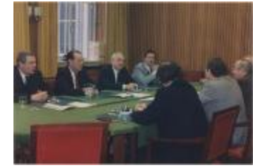
Vergadering Schepencollege (1988) (Foto 05934-08)