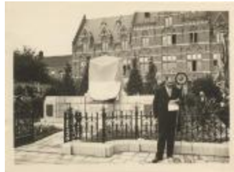
Onthulling monument Renier Snieders (Foto 01132-02 en 04 en 07 en 08)