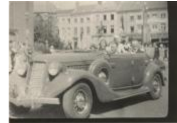
KVRO dag / Bezoek minister Hoste 1937 (Foto 01175-04)