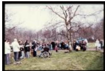
Babyboomplanting (Dia's container 47_3029 + 30)