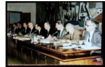
Schepencollege (Dia container 47_3082)