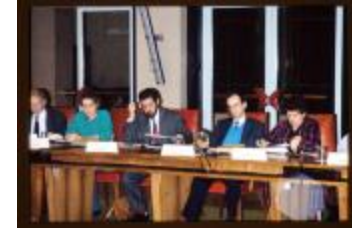
Gemeenteraadsleden (Dia container 9_2352)