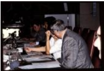
Vergadering (Dia container 47_3046)