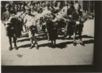
KVRO dag / Bezoek minister Hoste 1937 (Foto 01175-05)