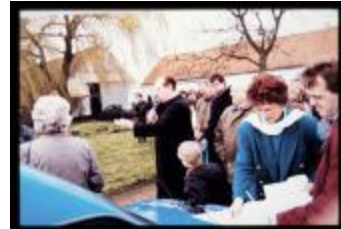
Babyboomplanting (Dia container 47_3031)