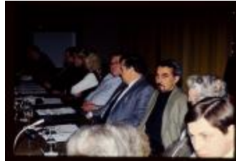
Bijeenkomst (Dia container 59_34)