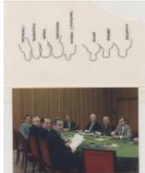
Vergadering Schepencollege (1988) (Foto 05934-10)