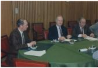
Vergadering Schepencollege (1988) (Foto 05934-05)