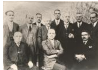
Leden van stadspersoneel en bestuur, liefdadigheidstombola (Foto 03553_01)