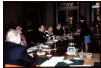
Vergadering (Dia container 47_3081)