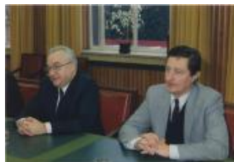
Vergadering Schepencollege (1988) (Foto 05934-02)