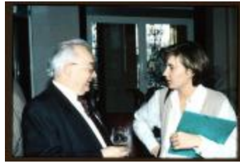
Onthaaldag (Dia container 41_3650)