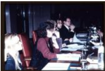
CVP-fractie (Dia's container 38_3480 + 89 + 90)