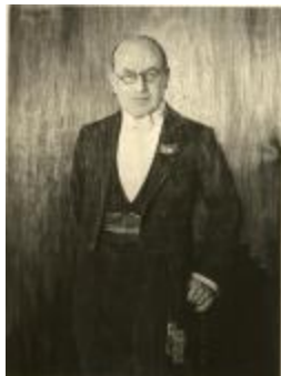
Portret A. Van Hoeck : houtschooltekening Ch. Vander Velpen (Foto 04725_01)