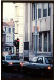
Verkiezingen (Dia container 32_1526)