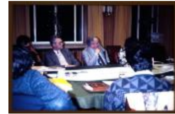
Vergadering (Dia container 57_15)