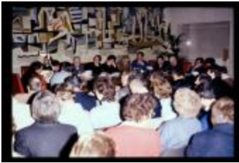
Vergadering (Dia container 53_48)