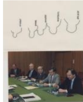
Vergadering Schepencollege (1988) (Foto 05934_11)