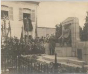
Onthulling monument Renier Snieders / Alf. Van Hoeck (Foto 01060_01)