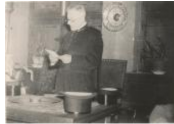
KVRO dag / Bezoek minister Hoste 1937 (Foto 01175-01 en 02 en 03)