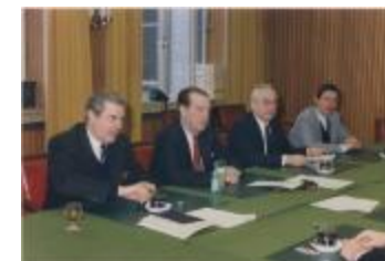
Vergadering Schepencollege (1988) (Foto 05934-04)