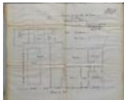
De Ridder, Steenweg op Mol nr. 44, veranderingswerken, 19/7/1926 (BOUW#1926/1682)