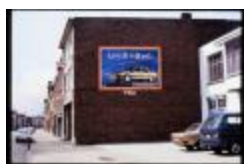
Steenweg op Mol (Dia container 15_1704)