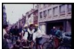
Tijl en Nele (Dia container 4_7)