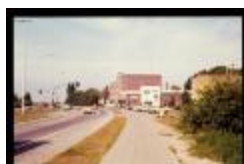
Miko (Dia container 1_62)