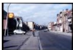
Otterstraat - Garage Deckx (Dia container 36_486)