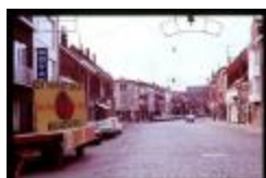
Turnhoutse straten (Dia container 1_57)