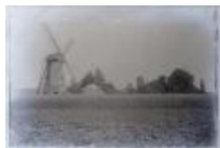
Verdwenen molen nabij fabriek Van Mierlo Steenweg op Mol N° 925 (Glas_04_90)