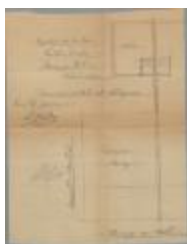
Van Loon Corneel, Steenweg op Mol nr. 42, bouwen scheidingsmuur en schob achter eigendom, 27/5/1927 (BOUW#1927/288)