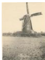
Molen / Stenenwindmolen Stwg. Op Mol (De Zweep) (Foto 00664-01)