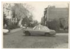
Steenweg op Mol (07333-09)