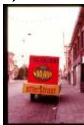
Steenweg op Mol (Dia container 1_59)