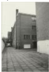
Stwg. op Mol (Foto 07038-18)