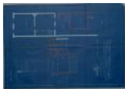
Cavents Leop., Steenweg op Mol nr. 16, veranderingswerken aan woning (bij metsen schob, gemak, regenwaterput en schransmuur), 13/8/1927 (BOUW#1927/352a bis)