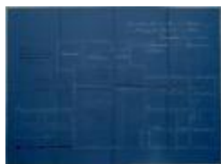
De Ridder, Steenweg op Mol nr. 44 Sectie N nr. 255b, bouwen schransmuur aan woning, 10/6/1927 (BOUW#1927/314)