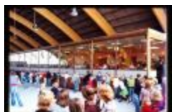
Ijsbaan (Dia container 3_9)