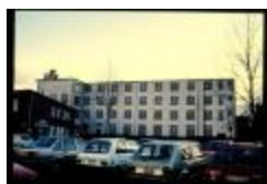
Museum (Dia container 5_2415)