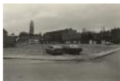
Parking Muylenberg vanuit Druivenstraat (Foto 06928-02)