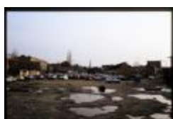
Mesmaekers - Parking (Dia container 36_427)