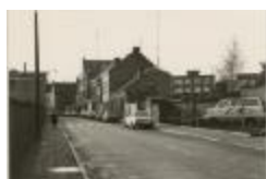
Druivenstraat (Foto 07034-01)