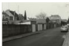
Fabriek Keuppens-Leysen nu Speelkaartenmuseum (Foto 07034-09)