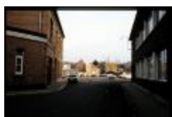
Mesmaekers - Hoek Druivenstraat (Dia container 36_428)