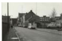
Druivenstraat (Foto 07034-02)