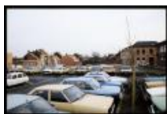
Mesmaekers - Parking Muylenberg (Dia container 36_429)