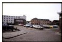
Mesmaekers - Parking Muylenberg (Dia container 36_430)