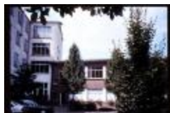
Exterieur (Dia container 41_3638)