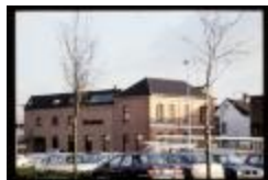
Muylenberg-plein (Dia container 36_437)