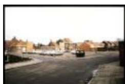
Mesmaekers - Parking Muylenberg (Dia container 36_431)