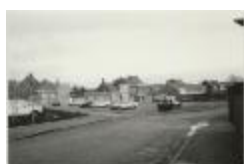
Parking Muylenberg (Foto 07036-09)