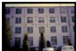
Vorgevel Nationaal Museum van de Speelkaart (Dia container 61_B29)