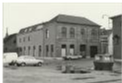
Druivenstraat (Foto 07036-15)