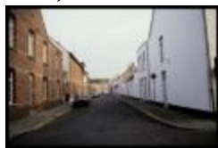
Hendrik Consciencestraat (Dia container 36_432)