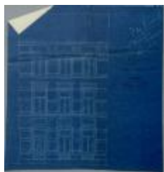
Van den Dungen- Kriër, Statiestraat, veranderingen aan huizing, 19/3/1906 (BOUW#1906/4028)