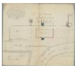
Nuyens, Statiestraat (recht tegenover nieuwe Statiestraat ), Paviljoen maken nieuwe trap, 7/8/1867 (BOUW#1011)