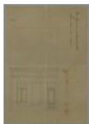
Vandenbosch Jos, Statiestraat , bouwen huizing, [4]/3/1887 (BOUW#1002)