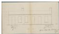
Borghs , Statiestraat (naast Driezen-schoenmaker), bouwen 3 huizen, 19/3/1870 (BOUW#1006)