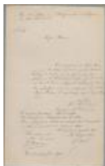
Faes Jos, Statiestraat , Wijk P nr. 131, bouwen huis, 5/8/1893 (BOUW#1022)