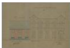
Mertens, Statiestraat , Wijk 4 nr. 98, vergrooting van huizing, 14/1/1869 (BOUW#1029)