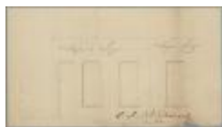
Devocht J.B., Statiestraat , nr. 8, veranderen huizing, 8/4/1895 (BOUW#919)