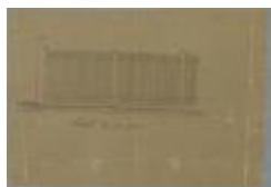
Faes Ant., Statiestraat , Wijk P nr. 131, bouwen houten afsluiting, 26/2/1891 (BOUW#1601)