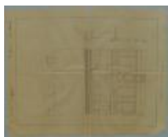
Loozen , Statiestraat , bouwen huis, 21/4/1891 (BOUW#1014)