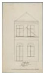
Nuyens, station, het octrooihuis, verandering aan eigendom, 17/9/1860 (BOUW#1016)