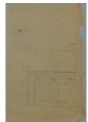
[[enraets, Statiestraat , Wijk P nr. 137, verandering aan huis, 13/5/1870 (BOUW#1008)