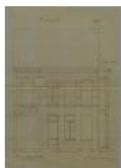
Van Dooren Petrus, Statiestraat , Wijk P nr. 131f/2 en 131g/2, bouwen huis, 12/2/1887 (BOUW#1003)