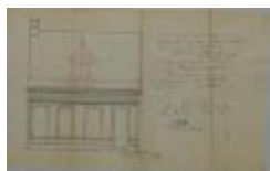
Sterkens-Clijmans, Statiestraat nr. 47 (of nr. 10), plaatsen dakvenster en uithangbord, 10/8/1904 (BOUW#1904/3845)