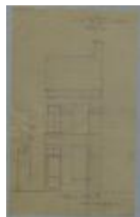
Goossens, Station, Wijk P nr. 131[c], bouwen huizing, 1/2/1879 (BOUW#1013)