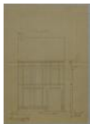
Wouters G., Statiestraat , Wijk 4 nr. 200, bouwen huis, 4/5/1886 (BOUW#1005)