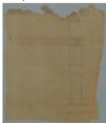
Jenraets, Statiestraat , Wijk P nr. 137, verandering aan huis, 13/5/1870 (BOUW#1009)