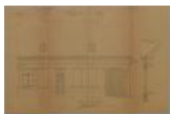
J. Botermans en Co (Gilze), Hannuitstraat, bouwen van woning met boterfabriek, Sectie Q nr. 480m, 18/3/1896 (BOUW#2064)