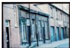
Huizenrij (Dia container 38_3401)