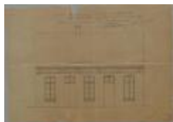
Kinderen Van Gorp, Hannuistraat, bouwen van 2 huizen, 10/10/1874 (BOUW#2060)