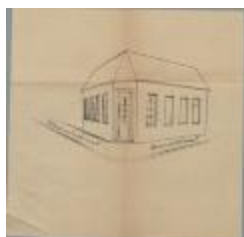
Verbaandert F., Hannuitstraat, open maken raam van woning langs kant Hannuitstraat, 30/10/1923 (BOUW#1923/9322)