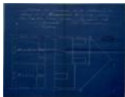
Lodewijk Loyens, Hannuitstraat nr. 25, vernieuwen achtergevel, 22/7/1930 (BOUW#1930/829)