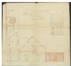
Dierckx Lod., Hannuitstraat nr. 34, veranderingswerken aan woning, 24/3/1924 (BOUW#1924/9518)