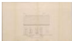
Bertels, Hannuitstraat, bouwen van 2 huizen, 28/8/1874 (BOUW#2059)