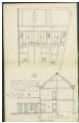
Aerts Fr. hoek Begijnendreef en Hannuitstraat Wijk 4 Sectie Q nr. 480f2, bouwen 3 woningen, 31/3/1905 (BOUW#1905/3914)