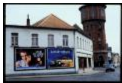
Kruispunt (Dia container 15_1723)