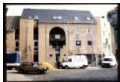
Huis (Dia container 26_3865)