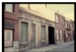
Hannuitstraat 25 K7 (container 35_2566)