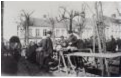
Wekelijkse markt (Glas_25_11)