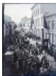
Procession de Turnhout. Le collège (Glas_05_05)