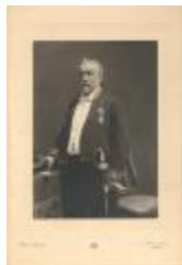
Vader v. Edw. Smolderen (portret) (Foto 0424-01)