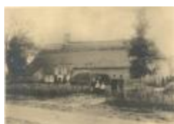
Geboortehuis Pieter De Nef (Foto 00795-01)