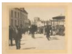
Markt / verkoop v. aangeslagen meubelen / kiosk (Foto 00957-01)