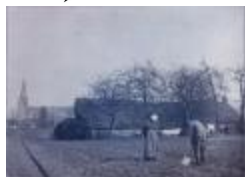
Kasterlee:Spittende boer (N° 395) (Glas_04_68)