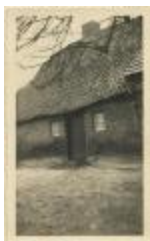
Hoeve "de oude Hoeve" (geboortehuis Klein Peerken) (Foto 04736_02)