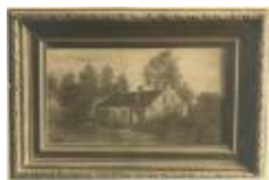
Karel Ooms / werken (Foto 04212_02)