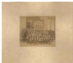
Jacobsschool (klasfoto) (Foto 00892-01 en 00893-01)