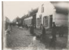
Bezemklokje in de Patersstraat (Foto 05781_01)