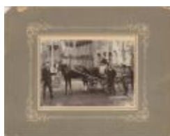
Kempische melkboer - melkboerin (Foto 00465-01)