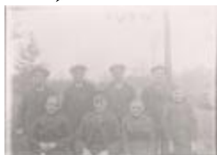
Groepsfoto landbouwers familie / ongeïdentificeerd (Foto 05470_01; 05470_02; 05470_03)