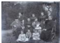
Invités a la campagne (Glas_15_02)