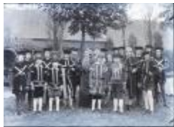
Groupe de Montenegrins (Glas_14_03)