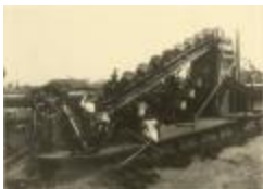
Familie Caron aan de kleiputten (Foto 04636_01)