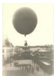
Oplaten van ballon op de Markt tijdens kermis (Foto 01301-01 en 02 en 03)