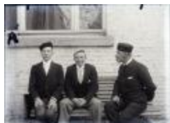
Familie foto (Glas_15_06)