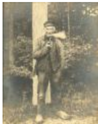
Boer in typische kledij (Foto 05233_01)