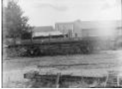
Houthandel bij de spoorweg (Glas_17_07)