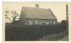
Hoeve "De Vuilkar" op Kastelein / exterieur (Foto 04734_01; 04734_02; 04734_03)