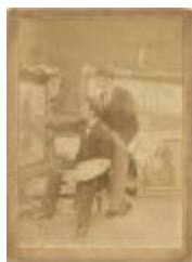
Portret Alfons De Clercq : kunstschilder (foto 03974_01)