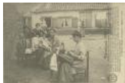
Kantwerksters in volksbuurt vóór 1914 (Foto 04836_01)