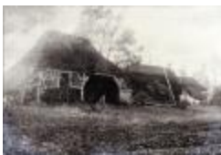
Fermes a Schuurhoven (Glas_25_06)