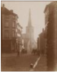
Kerk met vernield dak (Foto 06505-02)