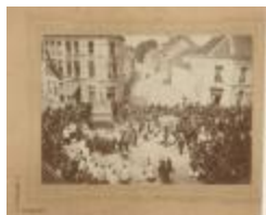
Processie aan de zeshoek (zicht Hofstr. -Renier Sniedersstraat)