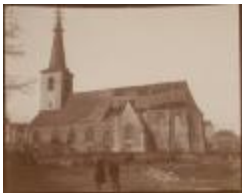
Kerk met vernield dak (Foto 06505-04)