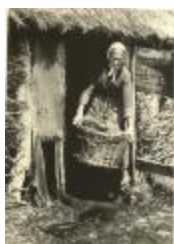
Turfsteken (Foto 04983_01 t.e.m. 04983_04)