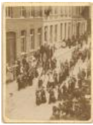
Processie in de Leopoldstraat (Foto 01304-01)