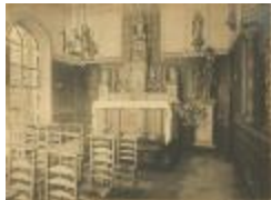
St. Antonius abt kerk / interieur (Foto 05230_02)