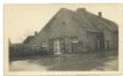
Hoeve "de Diepe" (woning Klein Peerken) / interieur + exterieur (Foto 04735b_01 t.e.m. 04735b_04)