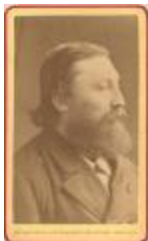
Portret van Peter Benoit (Foto 03341-02)