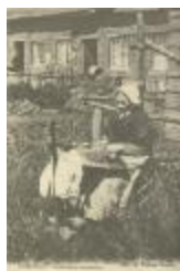
Kantwerksters (Foto 04835_01)