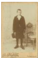
Portret jonge knaap met hoed en missaal (Foto 05257a_01)