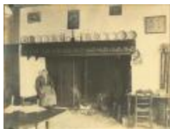
Kempische boerderij / interieur : open haard (Foto 05233_02)