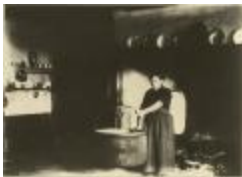
Hoeve ongeïdentificeerd / interieur (Foto 04629_01; 04629_02)