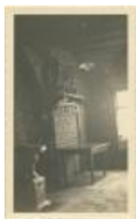
Hoeve "de oude Hoeve" (geboortehuis Klein Peerken) (Foto 04736_04)