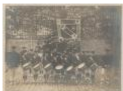
Muziekkapel St. Paulus Patronage (1843-1903) (Foto 06481-01)