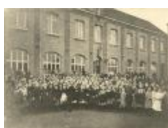
Kantschool Klinkstraat / groepsfoto alle leerlingen (Foto 04845_01)