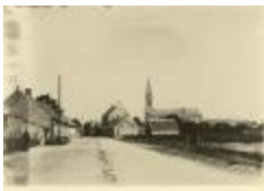
Dorpszicht met St. Willibrorduskerk (Foto 04628_01)