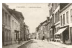
Gasthuisstraat (Foto 01020-01)