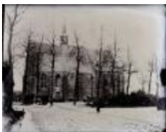
Sint-Antoniuskapel te Oosthoven (Glas_25_02)