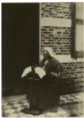
Kantwerksters (Foto 04626_02)