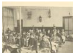
Kantschool / klas (Foto 04078_01)