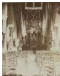
Versiering hoogaltaar St. Pieterskerk tijdens Mariafeesten (Foto 00467-01)