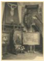
Karel Boom / interieur van atelier in Antwerpen (foto 03978_01 en 03978_02)