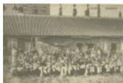
Kantschool in de Tien Geboden (Apostoliekenschool) (Foto 04837_01)