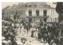
Processie aan de Zeshoek (Foto 01302_01 tem 03 en 01303_01)