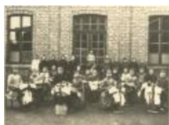
Kantschool Heilig Hart (Corbeelsstraat) (Foto 04839_01)