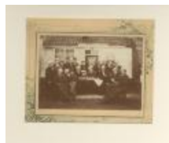
Vereniging "Quartier Noble" (foto 03736_01)