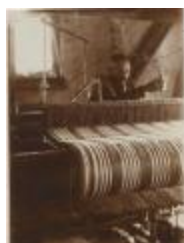
Huiswever (Foto 00865-01)