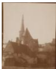
Kerk met vernield dak (Foto 06505-01)