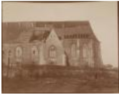
Kerk met vernield dak (Foto 06505-03)