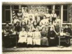
Kantschool Heilig Hart (Foto 04840_01)