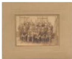
De Edele Handboog (Foto 00637_01)