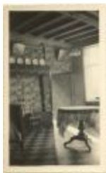
Hoeve "De Vuilkar" op Kastelein / woonkamer (Foto 04735a_01)