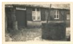
Hoeve "de oude Hoeve" (geboortehuis Klein Peerken) (Foto 04736_01)