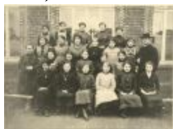
Kantschool Klinkstraat / klasfoto (Foto 04843_01 t.e.m. 04843_06)