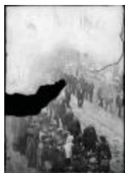
Procession de Turnhout (Glas_05_03)