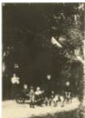
Familieportret familie Caron (Foto 04637_01)