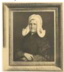
Karel Ooms / werken (Foto 04212_01)