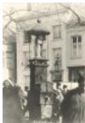
Botermarkt (Zegeplein) : Pomp (Foto 00526-01)