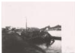
Kanaal / Oude kom / kaai (Foto 05475_01 t.e.m. 05475_05)