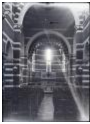
Interieur de l'Eglise de Oosthoven (Glas_05_08)