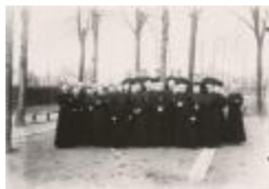
Groepsfoto / geestelijkheid / de Beralie? (Foto 05471_01)