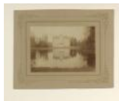
Kasteel Schollaert / exterieur (foto 03916_01)