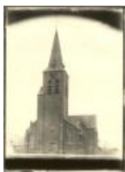
St. Lambertuskerk / exterieur (Foto 04080_01 en 04080_02)