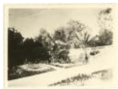
Karel Ooms / villa te Cannes (Foto 04211_01 en 04211_02)