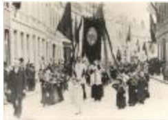
Processie in de Leopoldstraat (Foto 01304-02)