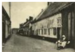
Kantwerkster in Papestraatje (Baron du Fourstraat) (Foto 04733_01)