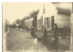
Het Bezemklokje (Patersstraat) (Foto 04500_01)