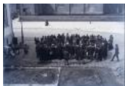
Grote Markt / Vismijn N° 867 (Glas_04_101)