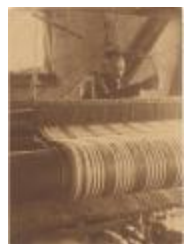
Huiswever (Foto 00865-02)