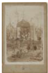
Kerkhofmonument (Foto 05677_02)