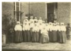
Groepsfoto gasthuiszusters (Foto 04638_01; 04638_02)