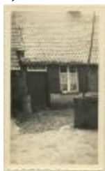
Hoeve "de oude Hoeve" (geboortehuis Klein Peerken) (Foto 04736_03)