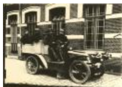
Een van de eerste auto's in Turnhout (Foto 04858_01)