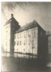
Kasteel van de Hertogen van Brabant: exterieur (Foto 03175_01 en 03175_02)