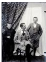
Familie foto (Glas_15_07)