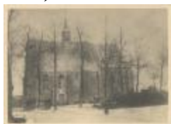
Oude St. Antoniuskapel te Oosthoven (Foto 05730_01)