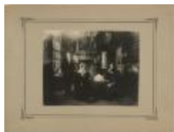
Schilderij Primus van Genechten en familie (Foto 00421-01)