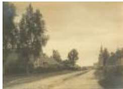
St. Antonius abt kerk (Foto 05230_01)