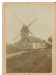
Molen (ongeïdentificeerd) (Foto 00269-01)