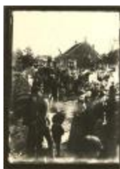
Processie (Foto 04859_01)