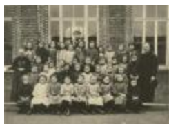
Kantschool Klinkstraat / klasfoto (Foto 04844_01; 04844_02)