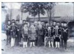
Groupe des Montenegrin (Glas_14_04)