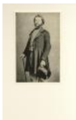
Portret Jan Luyten : beeldhouwer (foto 03937_01)