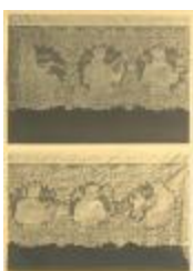
Kanten kled voor kommuniebank (gemaakt te Oosthoven) (Foto 05182_01; 05182_02)