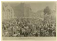
Maandelijkse veemarkt (Foto 05243_01)