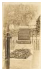
Graf v. Pater Damiaan / Damien Deveuster (Foto 00676-01)