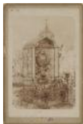
Kerkhofmonument (Foto 05677_03)