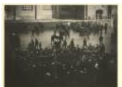
Grote Markt / de vismijn/paardenmarkt (Foto 04829_01)