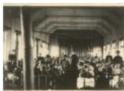
Kantschool Klinkstraat / interieur klassen (Foto 04841_01 t.e.m. 04841_05)