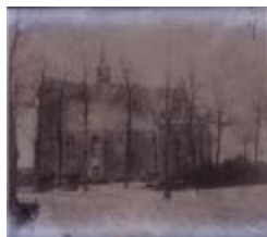
St.Antoniuskapel Oosthoven (verdwenen) N°352 (Glas_04_119)