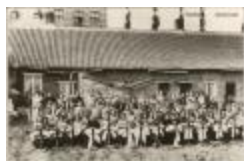
Kantschool in de Apostoliekenstraat (Foto 01019-01)