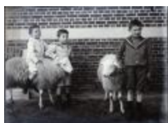
Les petits Amsens (Glas_15_05)