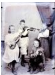
Familie foto (Glas_14_01)