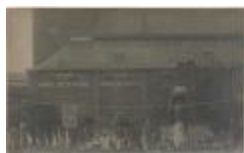
Feest van Christus (voor St. Pieterskerk op de Markt) (Foto 00541-01 en 02)