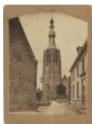
Kerk St. Pieter in zijn Banden (Foto 01282-01)