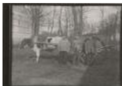
Groepsfoto landbouwers voor koespan met Karel Van Troij (Foto 05472_01; 05472_02)