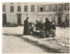
Markttaferelen / Oostkant v.d. Grote Markt (Foto 00821_01)