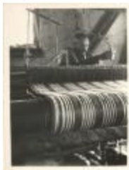
Huiswever (Foto 00865-03)