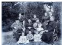
Invités a la campagne (Glas_15_03)