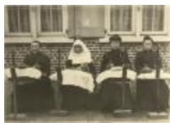
Kantwerksters (Foto 04626_01)