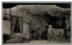
Toneelstuk L'abbé Constantin (Amicitia_050)