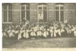
Kantschool H. Graf (Patersstraat) (Foto 04838_01)