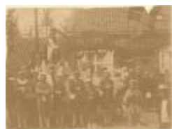
Stoet bij gelegenheid jubelfeesten "de vrienden der armen" (Foto 04747_01)