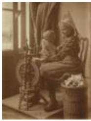
Ambachten / spinnen / spinsters (Foto 05225_01; 05225_02)