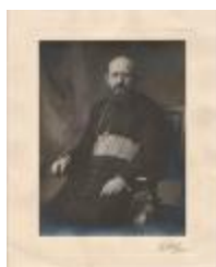
Portret Monseigneur Pelckmans (Foto 06479-01)