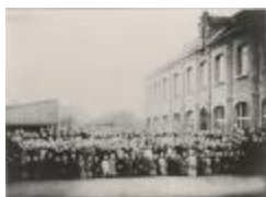
Kantklassen / groepsfoto (Foto 05906-06)