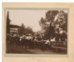
Engelse hof / Hof van Oosthoven (Foto 00955-01)