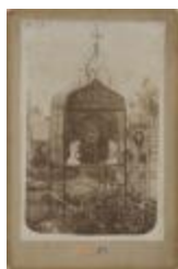
Kerkhofmonument (Foto 05677_01)