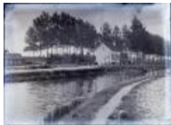
Brug 1 / Vue de Turnhout (Glas_08_03)