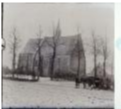
Sint-Antoniuskapel te Oosthoven (Glas_25_03)