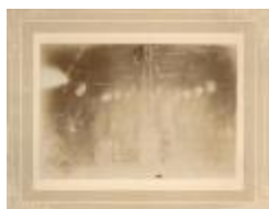
Boren v.e. put voor de waterleiding (Foto 00949-01)