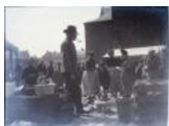
Markttafereel / Pottenhandelaar (Glas_04_102)