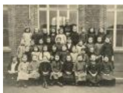
Kantschool Klinkstraat / klasfoto (Foto 04842_01 t.e.m. 04842_06)