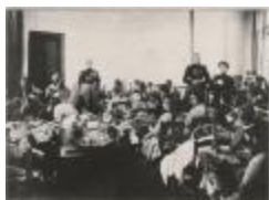
Kantklassen / groepsfoto (Foto 05906-07)