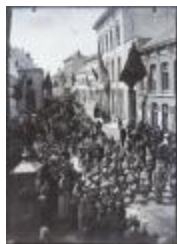
Procession de Turnhout (Glas_05_04)