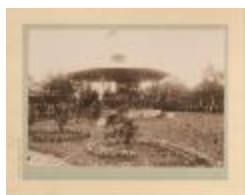
Engelse hof / Hof van Oosthoven / Concert Orpheus (Foto 00956-01)