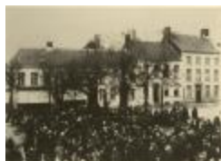
Marktscènes op Botermarkt (Zegeplaats) (foto 04623_01 t.e.m. 04623_09)