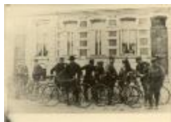
Eerste Wielclub van Merksplas (in V. van Halstr.) (Foto 04309_01)