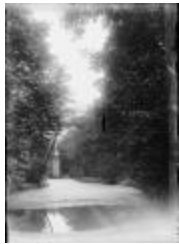
Landschap met vijver en toren (Glas_17_08)