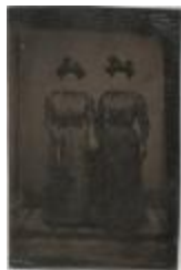
Portret / ongeïdentificeerd / dames (Foto 05685_04)