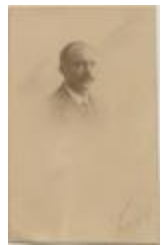
Portret / ongeïdentificeerd / heer (Foto 05685_05)