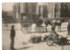
De mallenpost / Turnhouthse diligence "het postje" (Foto 00560-01 en 02 en 03 en 04 en 05 en 06 en 00561-01)