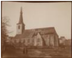
Kerk met vernield dak (Foto 06505-05)