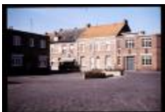
Kongoplein (Dia container 46_375)