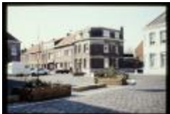
Kongoplein (Dia container 46_373)