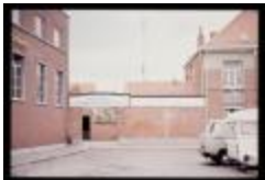
Kongoplein - School (Dia container 46_374)