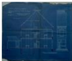
Van den Bergh A., Prinsenstraat tussen bestaande woningen nr. 30 en 32, bouwen huizing, 9/10/1912 (BOUW#1912/5099)