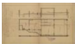
Verbeek Aug., Prinsenstraat Wijk P nr. 144 (deel), aansluiten met stadsriool, 19/9/1924 (BOUW#1924/9710)