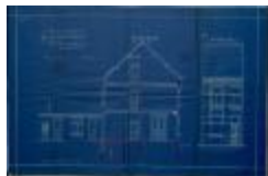
Deckers Alf., Prinsenstraat, bouwen huizing, 14/7/1914 (BOUW#1914/5435)