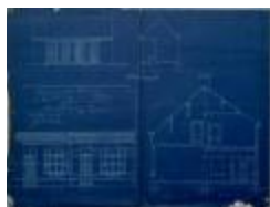
Hermans J., Staatsbaan van Turnhout naar Diest nr. 1328c, veranderingen aan woning en ernaast bouwen nieuw huis, 28/10/1904 (BOUW#1904/3875)