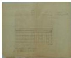
Brouwers J., Staatsbaan van Turnhout naar Diest wijk L nrs. 409a en 409b, bouwen huis, 16/7/1901 (BOUW#1901/3485)