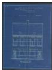
Dekkers Will., Prinsenstraat, bouwen 2 huizen, 22/7/1914 (BOUW#1914/5443)