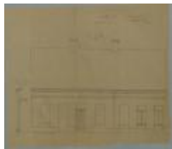
Van Dooren, Steenweg op Mol, Wijk C nr 854d, bouwen van 3 woningen (of 1 huis volgens college), 11/11/1897 (BOUW#429)