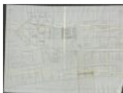
Hens, Molse steenweg nrs. 151 en 153 - Steenweg van Turnhout naar Mol, bouwen washuizen aan woningen - plaatsen riolen binnen huizen en afsluiting van hof met muur, 19/12/1908 (BOUW#1908/4421)