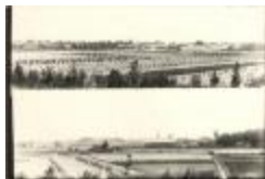
Algemeen zicht op Turnhout voor aanleg Prinsenstraat (Foto 01478-01)