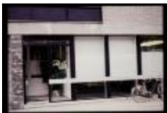
Tandtechnisch Labo (container 33_1330)