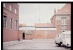
Kongoplein - School (Dia container 46_374)