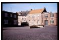
Kongoplein (Dia container 46_375)