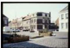
Kongoplein (Dia container 46_373)