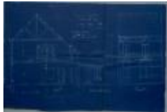
Luyckx-Gijsbrechts P., Nieuwstad - Selderbosch, bouwen woning, 3/4/1909 (BOUW#1909/4457)