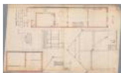
Vermeer Jos, Nieuwstad, bouwen huizing, 20/1/1909 (BOUW#1909/4434)