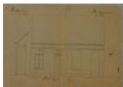
Wyggers A. (de kinderen), Nieuwstad, afbreken 2 huizen en heropbouwen, 8/7/1889 (BOUW#1436)