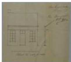
Dierckx, Nieuwstad, De Buitenmuur oprichten huizing, 9/4/1887 (BOUW#1442)