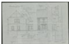
Van Gisbergen F., Nieuwstad - Selderbosch, bouwen huizing, 8/3/1910 (BOUW#1910/4600)