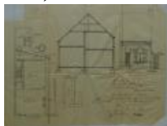
Luyckx P., Selderbosch - Nieuwstad Sectie R nr. 536 z, bouwen huizing, 1/10/1904 (BOUW#1904/3862)