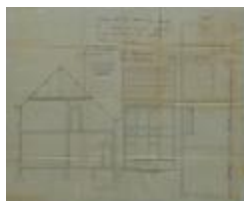
Tuytelaers Ch., Nieuwstad - Selderbosch, bouwen huizing, 29/11/1910 (BOUW#4737)