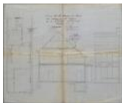
Huysmans Alf., Nieuwstad - Selderbosch, bouwen huizing, 21/3/1911 (BOUW#1911/4794)