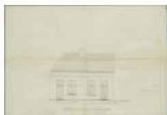
Bertels-Boons (weduwe), Nieuwstad, bouwen 2 woningen, 27/11/1873 (BOUW#1433)