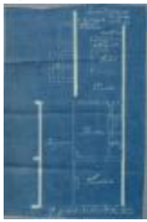
Van Gorp [P.], Selderbos - Nieuwstad, bouwen huis, 28/1/1909 (BOUW#1909/4437)