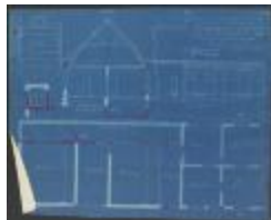
Schenkels-Van Beeck F., Nieuwstad nr. 70, veranderingen aan woning, 18/2/1905 (BOUW#1905/3900)