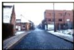
Hoek Baron Frans du Fourstraat - Hoveniersstraat (Dia container 36_449)