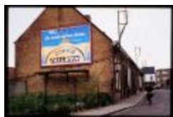
Nieuwstad (Dia container 15_1725)