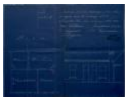
Willems, Nieuwstad nr. 30, veranderingswerken, 7/3/1930 (BOUW#1930/656)