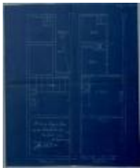
Leysen-Bax Fr., Nieuwstad - Selderbosch, bouwen huizing, 5/4/1909 (BOUW#1909/4464)