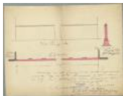
Kuppens (de kinderen), pad gaande van Akkerpad naar Nieuwstad Wijk R nr. 539 [c], 12/5/1908 (BOUW#1908/4323)