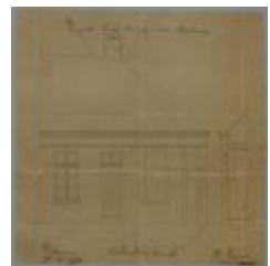
Hoskens C., Nieuwstad (met hoek weg naar Oosthoven), bouwen 2 woningen, 6/6/1889 (BOUW#1437)