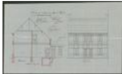
Dufour Fr., Nieuwstad, afbreken 7 huizen en dezelfde herbouwen in 6 woningen, 5/4/1909 (BOUW#1909/4461)