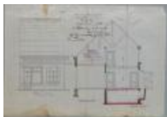
Van Noppen Leop., Nieuwstad, veranderen stalling, 10/2/1910 (BOUW#1910/4593)