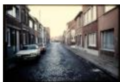
Nieuwstad (Dia container 36_447)