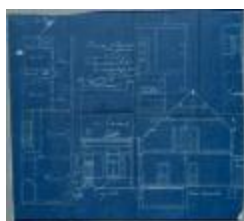
Dierckx Fr., Nieuwstad, bouwen huizing, 23/9/1908 (BOUW#1908/4395)