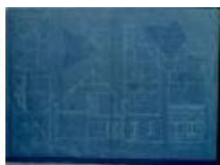
Van Gorp P., Selderbosch - Nieuwstad, bouwen huizing, 10/12/1908 (BOUW#1908/4418)