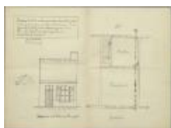
Arduwie Joz., Nieuwstad nr. 42, optrekken steenschen tusschengevel tot onder nok huis, 20/1/1925 (BOUW#1925/9856)