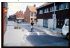
Vredestraat (Dia's container 7_845 + 846)