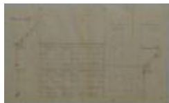
Dierckx, Nieuwstad, de buitenmuur bouwen huizing met gedeelte stal, 20/2/1896 (BOUW#1429)