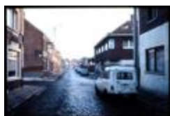
Nieuwstad - Hoek Maasstraat - Schoolstraat (Dia container 36_448)