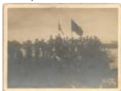
Turnhout. Vakantieschool aan de vennen Zwart Water. (Foto's 00139_01; 00139_02; 00139_03)