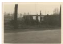
Stwg. Op Baarle Hertog / gevel van huis (Foto 06940-03)