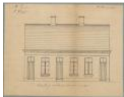
Goossens, Steenweg op Baarle-Hertog (tegenover gasgesticht), bouwen 3 nieuwe woningen, 4/9/1876 (BOUW#228)