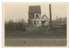
Stwg. Op Baarle Hertog / gevel van huis (Foto 06940-02)