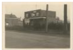
Stwg. Op Baarle Hertog / gevel Café Half-Weg (Foto 06940-01)