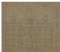
Taeymans, Antwerpse Steenweg, bouwen 3 huizen, 29/9/1894 (BOUW#1904)