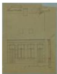
Devolder Florant, Kruishuis, bouwen 2 werkmanswoningen, 6/10/1894 (BOUW#1909)