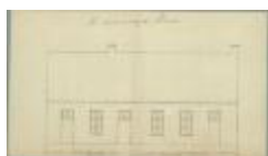
De Somer van [.....], weg van Antwerpse steenweg naar gehucht Stokt, bouwen 3 woningen ivv 3 bouwvallige, 12/11/1894 (BOUW#1907)