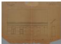
Mertens-Schillemans Guil., baan van Turnhout naar Tilburg-Patersstraat, nrs. 125 en 127 / sectie [Q] nrs. 122 en 123, heropbouwen gevel huizing, 5/4/1894 (BOUW#1894)