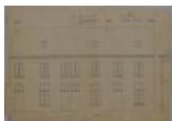
Dufour-Dessauer , Papestraatje, nrs. 15/25, bouwen 3 burgerswoningen in vervanging van bestaande nummers 15/25, 19/5/1894 (BOUW#1900)