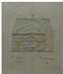
Weyts Adr., achter het station, palende noord eigendom, zuid en oost de straat en west Sint-Pietersgasthuis, "De Martelaren" bouwen 2 burgerswoningen, 3/7/1894 (BOUW#1890)