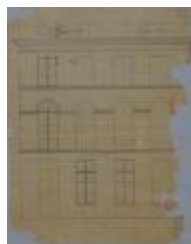
Dufour-Dessauer J. , steenweg van Turnhout naar Tilburg, afdeeling R nr. 420[e], veranderen raam in deur en een deur in raam, 5/5/1894 (BOUW#1899)