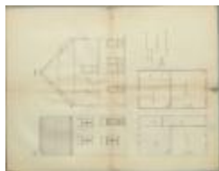
Nietvelt J, Prinsenstraat nr. 32 Wijk P nr. 143 b3, bouwen verdiep op woning, 18/6/1923 (BOUW#1923/9149)