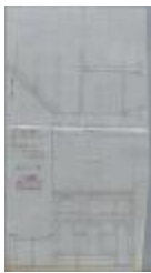
Geentjens-Fleerackers A., Prinsenstraat, bouwen huizing met aanhorigheden, 16/10/1911 (BOUW#1911/4875)