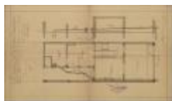
Verbeek Aug., Prinsenstraat Wijk P nr. 144 (deel), aansluiten met stadsriool, 19/9/1924 (BOUW#1924/9710)