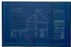
Deckers Alf., Prinsenstraat, bouwen huizing, 14/7/1914 (BOUW#1914/5435)