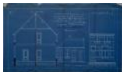
Wagemans Alf., pad gaande van Prinsenstraat naar de Tramlijn op Hoogstraten, bouwen huizing, 29/3/1913 (BOUW#1913/5177)