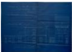
Derudder Ciriël, Prinsenstraat, bouwen woning, 7/3/1925 (BOUW#1925/9920)