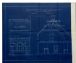
Diels-Huybs G., pad gaande van Prinsenstraat naar de Tramlijn op Hoogstraten, bouwen huizing, 29/3/1913 (BOUW#1913/5178)