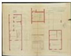
Verbeek A, Prinsenstraat, Wijk P nr. 144c, bouwen van een woning, 28/7/1924 (BOUW#1924/9651)