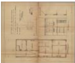
Verbeeck-Van Beneden Aug., Prinsenstraat Wijk P nr. 144c (deel), veranderingswerken aan voorgevel (vervangen vitrine in gewone raam en winkel deur vervangen door gewone inkomdeur), 21/4/1925 (BOUW#1925/9995)