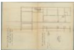
Peeters Edm., Prinsenstraat, aansluiten van in opbouw zijnde woning met stadsriool, 15/4/1925 (BOUW#1925/9977)