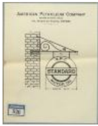
American Petroleum Company, Prinsenstraat nr. 42, plaatsen reclamebord aan voorgevel, 3/5/1929 (BOUW#1929/200)