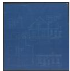
Haaren Leonard, Stoktakker Sectie P nr. 235, bouwen 2 woningen, 15/12/1903 (BOUW#1903/3773)