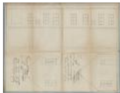
Vanden Plas, Stoksakker, plaatsen raam stal en in zijgevel deur plaatsen tvv raam, 23/3/1849 (BOUW#1065)