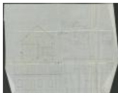
Van Dooren P., Stoksakker Sectie P nr. 247a, bouwen 3 burgershuizen, 28/7/1904 (BOUW#1904/3838)