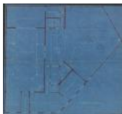
Luyten J., Hofstraat Sectie P nr. 101- op hoek met Statiestraten - aan watertoren, bouwen herberg met toneelzaal, 14/3/1907 (BOUW#1907/4165)