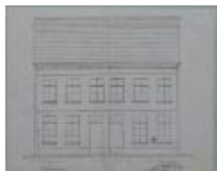
Bruggeman M., Hofstraat , bouwen woningen (2), 21/8/1874 (BOUW#315)