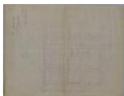
Bavelaar H., Hofstraat - hoek met Antwerpse Steenweg (Renier Sniedersstraat), Wijk 4 nrs. 158 en 159, afbreken 2 huizen en heropbouwen, 4/4/1882 (BOUW#1867)