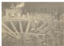
Watertoren / Opbouw - Fundamenten (Foto 00711_01)