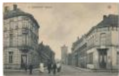
Turnhout Hofstraat (Prentbriefkaart 49_001)