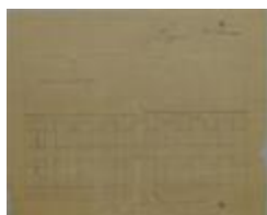
Bavelaar , Hofstraat , nrs 33 en 34, maken gebouw, 18/5/1878 (BOUW#1851)