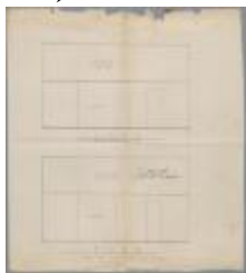
de Fierlant, Hofstraat (noordkant), gekochte schuur van de Godshuizen plaatsen poort en deur in de schuur, 30/6/1873 (BOUW#313)