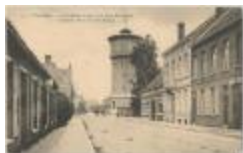
Turnhout. - Le Château d'Eau et la Rue du Jardin. [Het Water Kasteel en Hofstraat] (Prentbriefkaart 49_014)