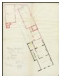
Goossens-Cos Jos, Hofstraat nr. 13, veranderen en vergroten woning, 24/8/1908 (BOUW#1908/4373)