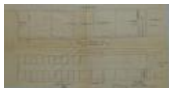
Nys (de kinderen), Leopoldstraat nr. 16, bouwen kelders met aanhorigheden, 21/3/1904 (BOUW#1904/3801)