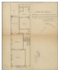
Fleerackers Henri, Leopoldstraat nr. 14, veranderingswerken aan eigendom, 17/5/1926 (BOUW#1926/1569)