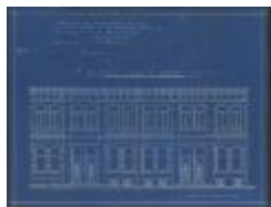
Versteylen Ben., hoek Sint-Antoniussstraat en Leopoldstraat - oude lokalen Katholieke Volksbond, bouwen 5 huizen, 26/6/1914 (BOUW#1914/5415)