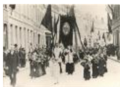
Processie in de Leopoldstraat (Foto 01304-02)