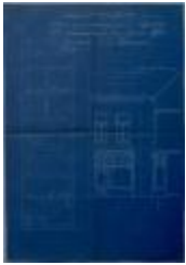
Thys, Leopoldstraat nr. 8, steken vitrine in voorgevel woning, 7/5/1926 (BOUW#1926/1561)