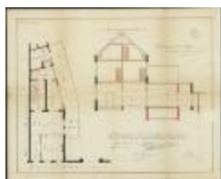
Versteylen B., Leopoldstraat nr. 9, uitvoeren veranderingswerken aan eigendom, 1/5/1922 (BOUW#1922/6075)