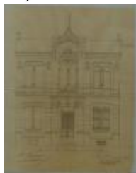
Leopoldstraat , Sectie 9 nr 448a, Nationale Bank bouwen gebouw, 11/4/1877 (BOUW#381)