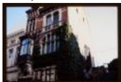
Premie (Dia container 62_A29)