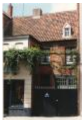
Gewelresten van het "oude gasthuis" Leopoldstraat (Foto 00444_01 tem 03)