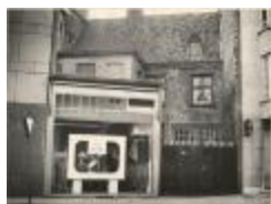
Leopoldstraat met muur van oude gasthuis (Foto FG-095)