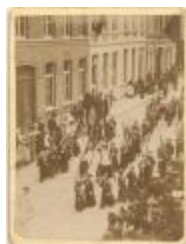
Processie in de Leopoldstraat (Foto 01304-01)