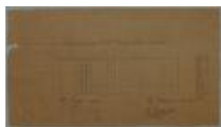
Volders - Sak, Leopoldstraat , bouwen muur, 20/5/1879 (BOUW#380 )