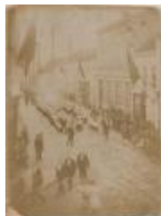
Processie Gasthuisstr-Leopoldstr. (ca. 1900) (Foto 06673-01)