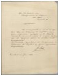
Sak Jos, Leopoldstraat, veranderingen aan eigendom, 25/1/1910 (BOUW#1910/4591)