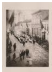
Processie Gasthuisstr-Leopoldstr. (ca. 1900) (Foto 06673-02)