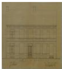
Peeters A., Leopoldstraat (begin straat), nrs. 44 en 45, bouwen 2 woningen, 12/5/1877 (BOUW#1846)