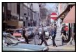
Verkeer (Dia container 29_730)