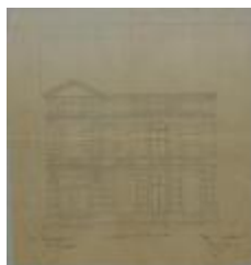
Gervais-Sak H., Leopoldstraat , bouwen gebouw, 10/2/1879 (BOUW#1852)