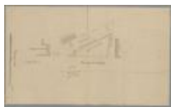
Dillen, Molenstraat, 11/2/1836 (BOUW#888)