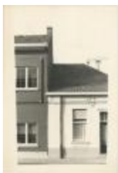
Molenstraat (Foto 06951-01)