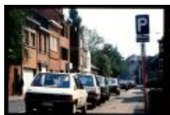
De Molenstraat met het kruispunt Vlamingenstraat (Dia 55_22_2242)