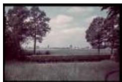
Vosselaer (Dia container 65_095)