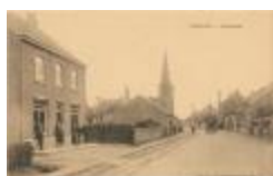
Desschel - Molenstraat (Prentbriefkaart 92_006)