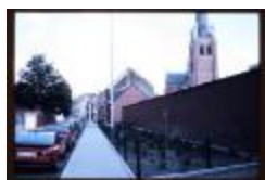
Molenstraat (Dia container 17_2603)