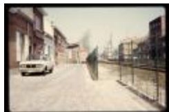
Kadasterstraat (Dia container 46_302)