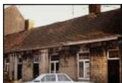
Krotwoningen Molenstraat (INSPRAAK_0099)