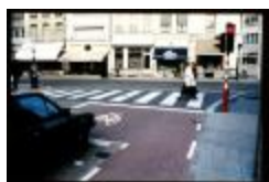
De Zeshoek (Dia 55_17)