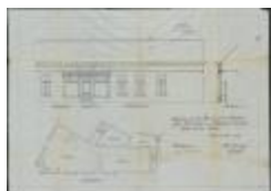
Bluekens C., hoek Victoriestraat met Molenstraat, steken 2 vitrines in vervanging van 2 ramen in voorgevel eigendom, 12/6/1924 (BOUW#1924/9594)