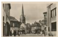
Turnhout - De Zeshoek (Prentbriefkaart 21_026)