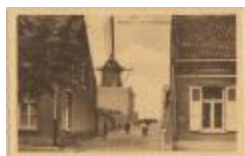
Beersse. - De Molenstraat (Prentbriefkaart 86_064)