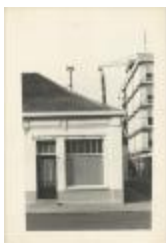
Molenstraat / Doorgang de Merodelei (Foto 06951-02)