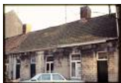
Huisjes (Dia container 15_1786)