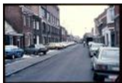
Molenstraat (Dia container 36_434)