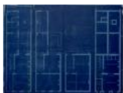
Peeters Fr., Molenstraat (Plein H. Hart), bouwen huizing, 17/5/1909 (BOUW#1909/4485)