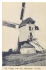
Vosselaar (AN) - Molenstraat -1795-1959 (Prentbriefkaart 152_049)