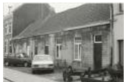
Molenstr (Foto 07040-01)