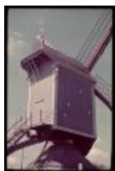
Vosselaer (Dia container 65_097)