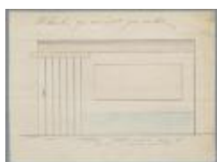
Thijs Cor, Molenstraat , bouwen afsluitingsmuur, 13/7/1877 (BOUW#902)