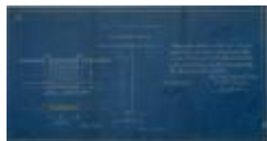
Smets H., Molenstraat, inrijpoort plaatsen en laten zakken stoeptegels, 10/7/1923 (BOUW#1923/9178)