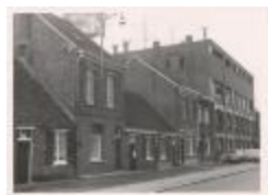
Molenstraat, Turnhout (Foto 06057-01, 02, 03, 04, 05, 06 en 07)