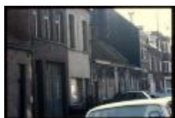
Molenstraat - Krotwoning (Dia's container 36_433 + 35)