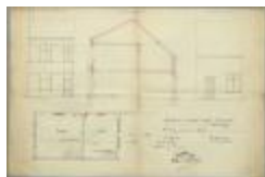
Lod. Van Dyck, Molenstraat nr. 133, veranderingswerken, 17/7/1929 (BOUW#1929/353)