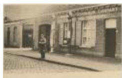
[Depot van de American Petrol. Company te Oud-Turnhout]. (Prentkaart 81_301)