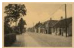
Oud-Turnhout. Steenweg Mol. (Prentkaart 81_051)