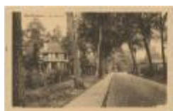
Oud-Turnhout. Zwaneven. (Prentkaart 81_067)