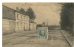
Oud-Turnhout. Tramstatie Het Zwaneven. (Prentkaart 81_059)