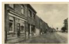
Oud Turnhout. Steenweg op Mol. (Prentkaart 81_039)