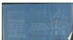
Ceelen Frans, Elisabethlei - Staatsbaan van Turnhout naar Breda Wijk B nr. 1022 [] (deel) - in de doortocht van Turnhout - linkerzijde, bouwen huizing, 14/2/1913 (BOUW#1913/5155)