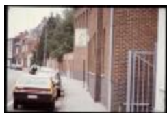
IVEKA Intercom (Dia container 12_1204)