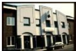
Voorgevel (Dia container 26_3848)