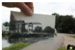
Liefste foto van brug 1 aan de oude vaartkom (EGC_0004_WM)