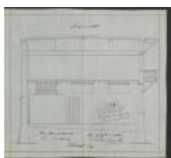
Van De Gejuchte Ph., Elisabethlei - 20 meter van Staatsbaan, bouwen broodbakkerij met aanhorigheden, 30/6/1913 (BOUW#1913/5235)