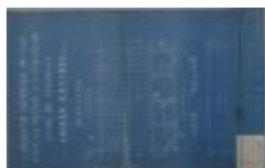
Gasfabriek, Elisabethlei, plaatsen grillie aan eigendom, 14/5/1923 (BOUW#1923/9119)