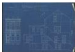
Van de Gejuchte, Elisabethlei, bouwen huis, 3/1/1914 (BOUW#1914/5334)