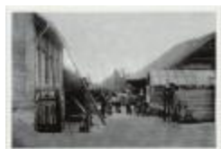
Koningin Elisabethlei / Bedrijf Levrie (Foto 07265-01)