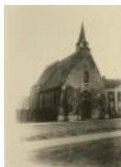
Theobalduskapel / exterieur (Foto 04537_01)