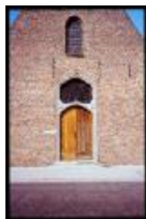
Theobalduskapel (Dia container 1_81)