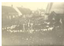
Theobalduskapel / Mariaverering / dankprocessie [1918] (Foto 04538_01 tem 04)