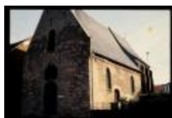
Theobalduskapel (Dia's container 7_831 + 8_888 + 915)