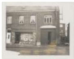
Koningin Elisabethlei / gevel van coiffure Italianus (Foto 06941-01)