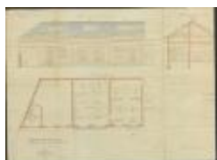
Compagnie Générale du Gaz pour la France et l'Etranger, Elisabethlei, bouwen machienzaal in Gasgesticht, 28/11/1912 (BOUW#1912/5121)