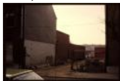
Achterliggend gebouw (container 39_245)