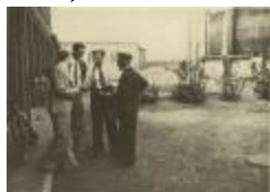
Gasfabriek Koningin Elisabethlei - exterieur - binnenkoer (Foto 05027_01)