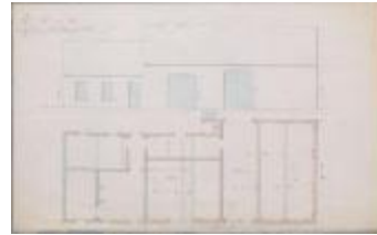
Kommissie der Godshuizen, Vellekens, sectie P nr. 54, veranderingen en verbeteringen aan gebouwen der hovenierderij van het beginhof, 2[1]/5/1880 (BOUW#2019)