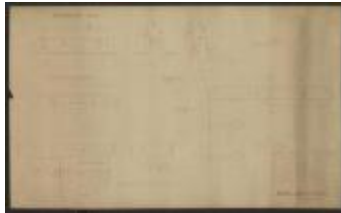
"Banque démontable. Vue d'ensemble", bouwtekening van een zitbank (Rol#176)