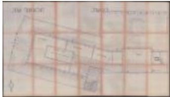
"Plaat 3", technische tekening van een houten kast, afdruk (ROL#112)