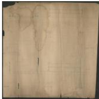
Een brug (ROL#027)