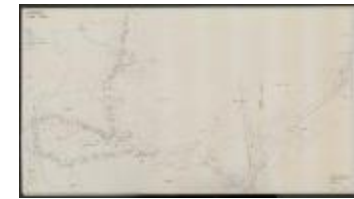
Belgisch-Nederlandse grens (ROL#083)