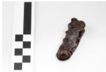
Fragment van een riemtong uit de merovingische periode aangetroffen bij de opgraving in de Krommenhof in Beerse. (2008_269_176)