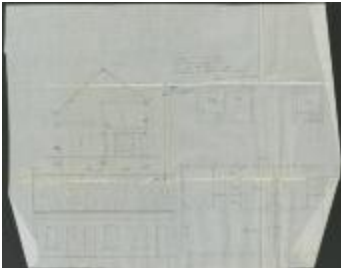
Van Dooren P., Stoksakker Sectie P nr. 247a, bouwen 3 burgershuizen, 28/7/1904 (BOUW#1904/3838)