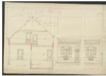
Pauwels-Nuyts J., Stoksakker Wijk P nrs. 231-230, bouwen 4 woningen, 26/3/1903 (BOUW#1903/3676)