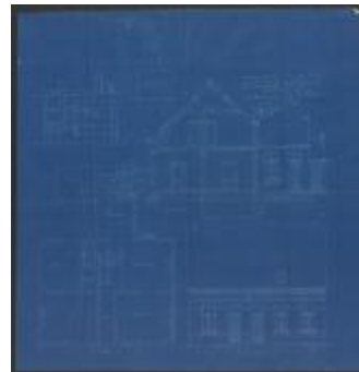
Haaren Leonard, Stoktakker Sectie P nr. 235, bouwen 2 woningen, 15/12/1903 (BOUW#1903/3773)