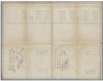
Vanden Plas, Stoksakker, plaatsen raam stal en in zijgevel deur plaatsen tvv raam, 23/3/1849 (BOUW#1065)