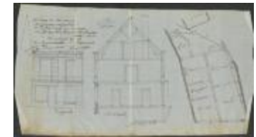
Raeymaekers K., Staatsbaan van Turnhout naar Tilburg, veranderingen aan huis, 23/4/1904 (BOUW#1904/3821)