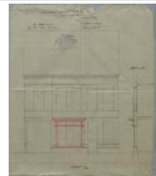
Van Roy-Dielen (weduwe), Paterstraat nr. 145 - Staatsbaan van Turnhout naar Tilburg - linkerzijde, uitbreken 2 ramen gelijkvloers en