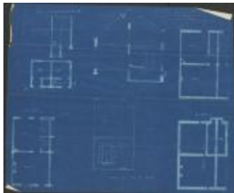
Dierckx (de kinderen), Staatsbaan van Turnhout naar Tilburg Wijk C nr. 1768 a bis (deel), bouwen 4 gelijkvormige huizen, 20/8/1904 (BOUW#1904/3848)