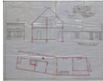
Horemans J.B., Steenweg op Oosthoven wijk C nr. 1033w - Staatsbaan van Turnhout naar Tilburg - tussen palen 1k en 2k - rechterkant, bouwen woning, 17/11/1910 (BOUW#1910/4724)