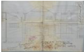
Kruyfhoofd Ch., Staatsbaan van Turnhout naar Tilburg - tussen palen 1k en 2k - rechterzijde, bouwen woonhuis en hangen dubbele poort, 17/5/1911 (BOUW#1911/4825)