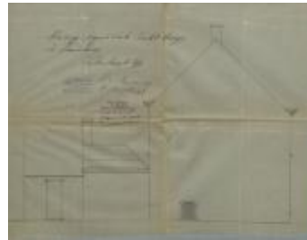
Crois August, Patersstraat (hoek Lindekenstraat) Wijk R nr. 210e - Staatsbaan van Turnhout naar Tilburg - rechterzijde, veranderen woning, 15/11/1911 (BOUW#1911/4893)