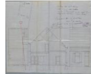
Bauweraerts P., Steenweg op Oosthoven wijk C nr. 1033w - Staatsbaan van Turnhout naar Tilburg - tussen de palen 1k en 2k - rechterzijde, bouwen huizing, 18/11/1910 (BOUW#1910/4725)