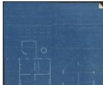
Lenaerts Jac, Staatsbaan van Turnhout naar Tilburg Wijk C nr. 1777, bouwen woonhuis met ingangspoort, 20/8/1904 (BOUW#1904/3849)