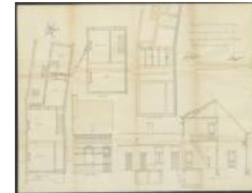
Van Gael (de kinderen), Staatsbaan van Turnhout naar Tilburg Wijk C nr. 1768 n2 - tussen kilometerpalen 1 en 2 - linkerzijde, bouwen woning, 18/11/1913 (BOUW#1913/5306)