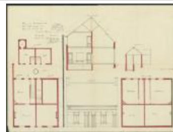
Van Lommel J., Staatsbaan van Turnhout naar Tilburg - tussen kilometerpalen 1 en 2 - rechterzijde, bouwen tweewoonst, 25/11/1909 (BOUW#1909/4571)