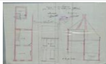
Lenaerts-Faes Aloïs, Staatsbaan van Turnhout naar Tilburg Sectie C nr. 1120a - tussen kilometerpalen 1 en 2, bouwen huizing, 27/9/1909 (BOUW#1909/4545)