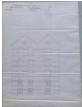
Peeters August, Groenstraat, bouwen mouterij, 8/10/1903 (BOUW#1903/3742)