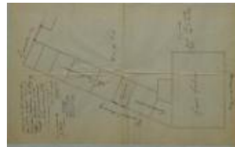
Vogels-Janssens J., Kasteelstraat en Groenstraat, verplaatsen inrijpoort, 23/3/1907 (BOUW#1907/4169)