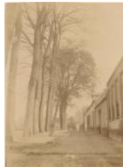
Kasteelplein kant Warandestraat (1903) (Foto 01300-01 en 02)