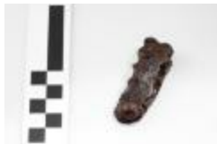
Fragment van een riemtong uit de merovingische periode aangetroffen bij de opgraving in de Krommenhof in Beerse. (2008_269_176)