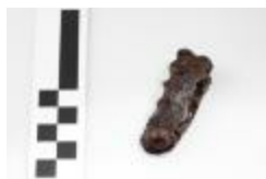
Fragment van een riemtong uit de merovingische periode aangetroffen bij de opgraving in de Krommenhof in Beerse. (2008_269_176)