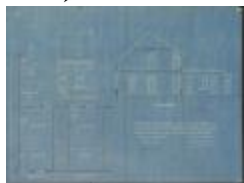
Gevers Aug., Rivierstraat tussen nrs. 35 en 37, bouwen woning, 18/6/1923 (BOUW#1923/9147)