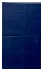
Dierckx Jos, Rivierstraat Wijk O nr. 600 e (deel), bouwen huis (of 2), 7/2/1912 (BOUW#1912/4940)