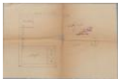
Lenaerts Lod., Rivierstraat nr. 1, bouwen regenbak en scheidingsmuur achter woning, 10/1/1928 (BOUW#1928/558)