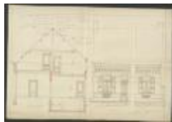
Pauwels-Nuyts J., Stoksakker Wijk P nrs. 231-230, bouwen 4 woningen, 26/3/1903 (BOUW#1903/3676)