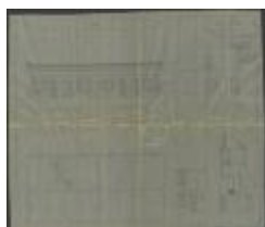
Van Dooren P., Stoktsakker Sectie P nr. 231, bouwen 4 woningen, 16/9/1905 (BOUW#1905/3975)