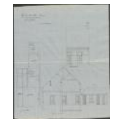
Van Liempt A. en Van Deun Aug., Stoksakker Sectie P nr. 247a, bouwen huizing met aanhorigheden, 15/7/1904 (BOUW#1904/3832)