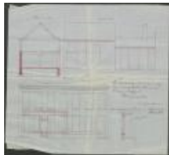
Kerremans J., Staatsbaan van Turnhout naar Hoogstraten nr. 477a, veranderingen aan huizing, 19/6/1902 (BOUW#1902/3586)