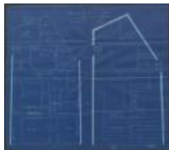
Verwilt A., Staatsbaan van Turnhout naar Hoogstraten Wijk P nr. 81, bouwen 2 huizen, 27/10/1903 (BOUW#1903/3759)