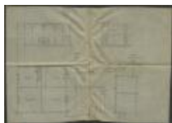
Luyckx, Staatsbaan van Turnhout naar Hoogstraten paal 1 sectie P nr. 248 (deel), bouwen 3 (of 4) woningen, 20/9/1902 (BOUW#1902/3612)