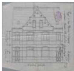
Van Ravestyn Gustaaf, Staatsbaan van Turnhout naar Hoogstraten - linkerkant, herbouwen 2 woningen, 11/5/1909 (BOUW#1909/4483)