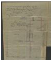
Maes-Van Bourgognie Ch., Staatsbaan van Turnhout naar Hoogstraten - Warandestraat nr. 103, veranderen huizen in twee woningen, 31/3/1906 (BOUW#1906/4040)