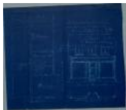
Boone Hortance, Staatsbaan van Turnhout naar Hoogstraten Wijk Q nr. 391[b] - Botermarkt (Warandestraat) nr. 5, veranderen woning, 24/2/1909 (BOUW#1909/4445)