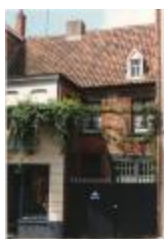
Gevelresten van het "oude gasthuis" Leopoldstraat (Foto 00444_01 tem 03)