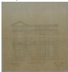
Gervais-Sak H., Leopoldstraat , bouwen gebouw, 10/2/1879 (BOUW#1852)