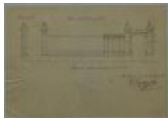
Vandenplas H., Leopoldstraat , maken grille naast eigendom, 10/7/1886 (BOUW#377 )