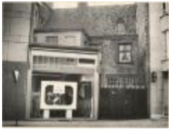
Leopoldstraat met muur van oude gasthuis (Foto FG-095)