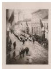
Processie Gasthuisstr-Leopoldstr. (ca. 1900) (Foto 06673-02)