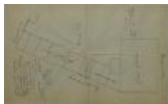
Vogels-Janssens J., Kasteelstraat en Groenstraat, verplaatsen inrijpoort, 23/3/1907 (BOUW#1907/4169)