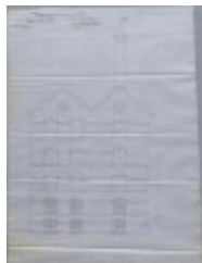
Peeters August, Groenstraat, bouwen mouderij, 8/10/1903 (BOUW#1903/3742)