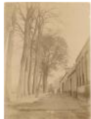
Kasteelplein kant Warandestraat (1903) (Foto 01300-01 en 02)