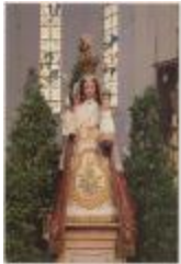
Processiebeeld van Maria Lelie onder de Doornen (Prentbriefkaart 61_070)