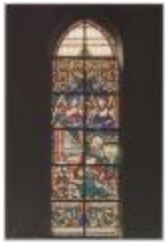
H. Hart Turnhout H. Cecilia (Prentbriefkaart 61_069)