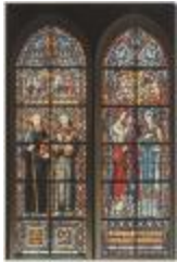
H. Hart Turnhout De Boodschap aan Maria Lou Asperslag, Heverlee 1936 en Benedictus en Franciscus Idem, 1937 (Prentbriefkaart 61_063)