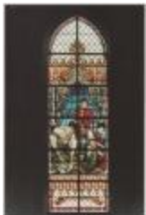
H. Hart Turnhout Werken van Barmartigheid De Naakten kleden : St. Martinus naar Ant. Van Dijk (Prentbriefkaart 61_065)