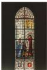
H. Hart Turnhout Werken van Barmartigheid De Zieken bezoeken : H. Elisabeth van Hongarije (Prentbriefkaart 61_068)