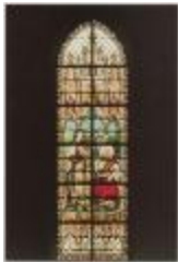
H. Hart Turnhout Werken van Barmartigheid De Dorstigen laven : de Samaritaanse Vrouw (Prentbriefkaart 61_066)