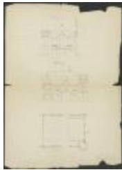
Borghs, Stede Engeland verlengenis bestaande beestenstal (BOUW#13)